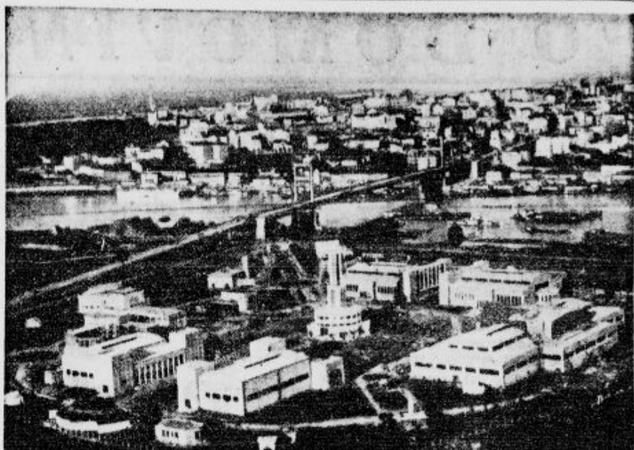
Pogled na razstavní prostor belgrajkega velesajma. V ozadju zemunski most in Belgrad.