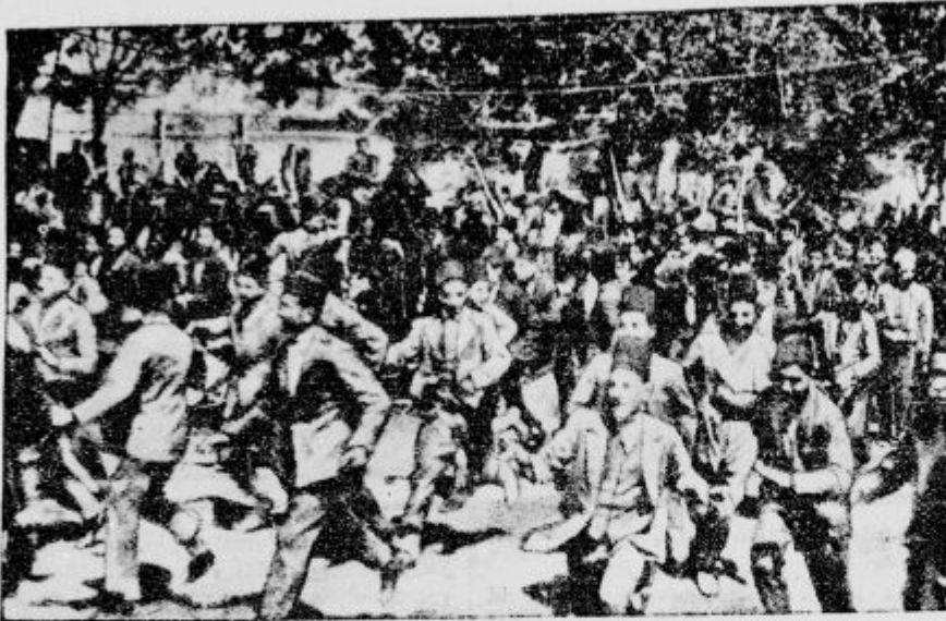
V Damasku v Siriji so ponovno izbruhnili teški nemiri, ki so naperjeni proti Franciji, ki ima nad Sirijo pokroviteljsko oblast.