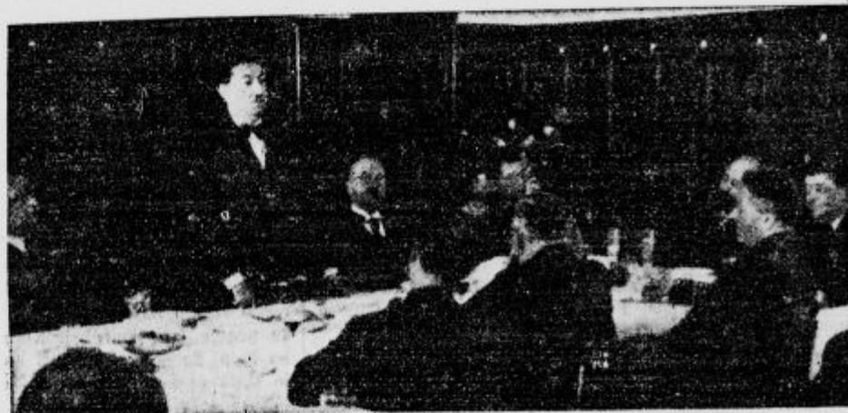
Predsednik vlade g. Dragiša Cvetkovič govori slovenskim častnikarjem v Celju