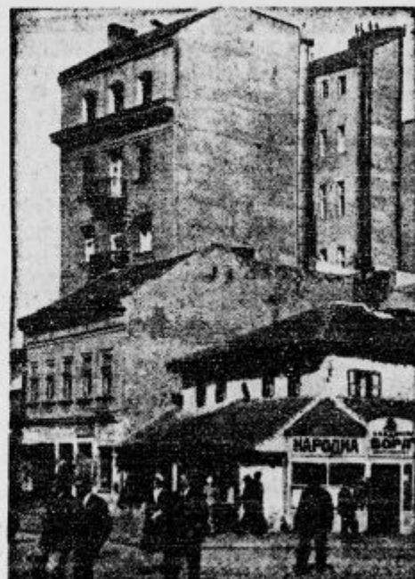
Stari in novi Belgrad. Stare majhne hišice se vedno bolj umikajo mogočnim palačam.