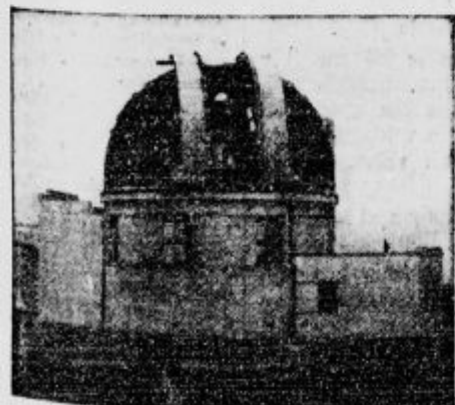
Zvezdarna v Belgradu.