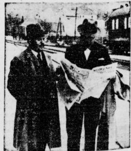
G. predsednik Dragiša Cvetkovič bere na postaji v Rožaki Slatini »Slovenca«.