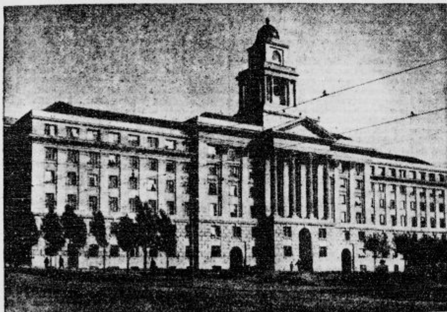
Palača prometnega ministrstva v Belgradu.