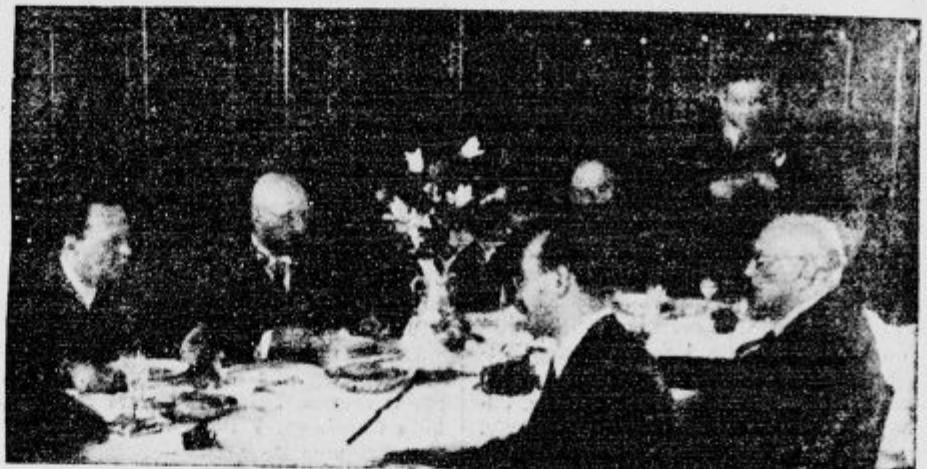
Predsednik senata dr. Anton Korošec med slovenskimi časnikarji v Celju.