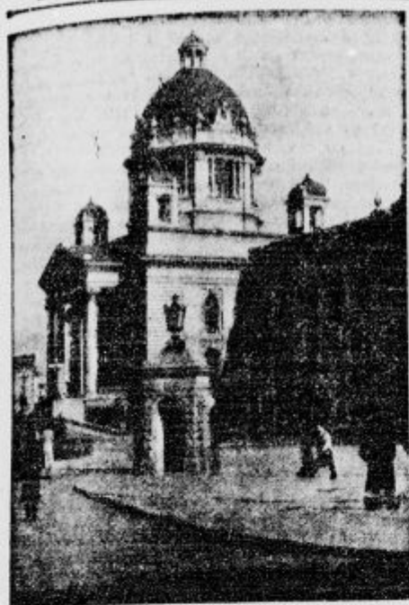
Pogled na narodno skupščino.