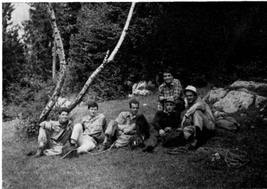
Naši mladi jamarji pred Golobejevo jamo 25. VII. 1963

V dolini potoka Kostanjevice je kar cela vrsta jam. Nekaj jih je že precej časa znanih, saj so jih že pred vojno merili prizadevni tolminski planinci. Ponovna izmera nekaterih jam kaže, da se naši rezultati precej razlikujejo od starih, čeprav ni dvoma, da smo se mudili v istih jamah. Menimo torej, da bi bilo potrebno vse jame ponovno natančno topografsko izmeriti in morfološko proučiti. Vse pregledane jame