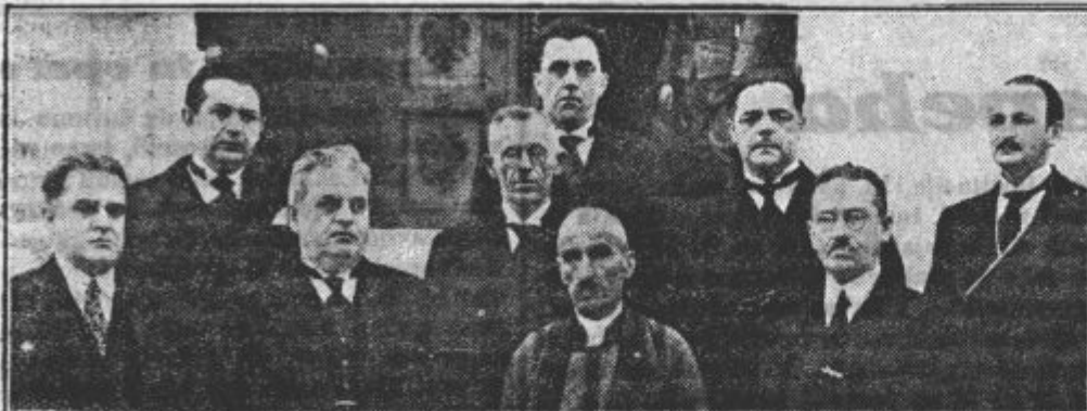
Predsedstvo naše narodne skupščine se je poklonilo na grobu blagopokojnega viteškega Kralja Aleksandra na Oplencu.