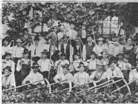
Po tekmi koscev v Vuzenici.

Združena Društva kmet. fantov in deklet Medvode, Moste, Skaručna, Šinkov turn, Voglje in Zapoge priredi v nedeljo, dne 21. julija popoldne propagandno tekmo žanjic v Vodichah. Ob 2. uri popoldne bo zbirališče žanjic, kolesarjev in ostalih skupin pred gasilnim domom v Vodichah. Ob 3. uri odhod povorke z godbo na čelu na tekmovališče. Nato se bo vršilo manifestacijsko kmetško-mladinsko zborovanje. Po zborovanju tekma žanjic, kjer tekmujejo dekleta od vseh društev. Kdor hoče videti kaj zna organizirana kmetška mladina, naj nas ta dan obišče!