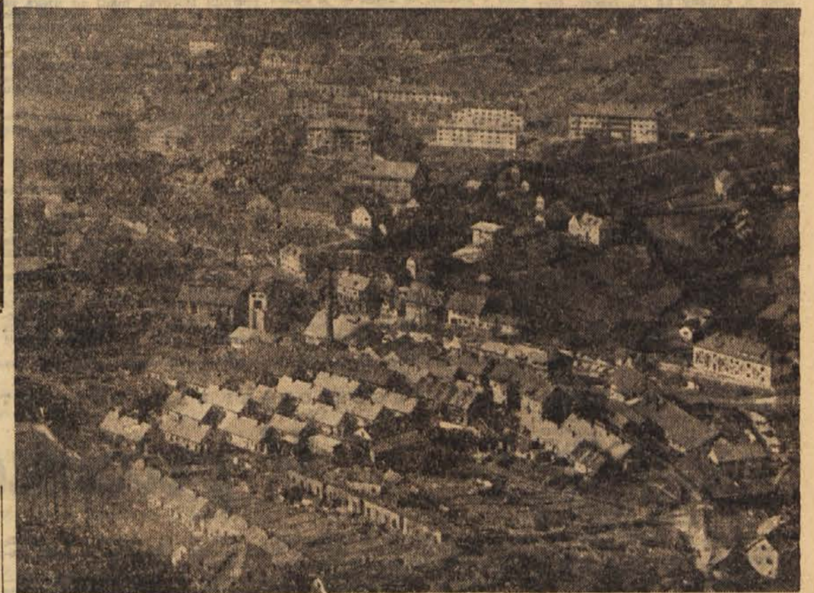
Pogled na Hrastnik

Kaj je dalo pobudo za ustanovitev steklarne v Hrastniku? V začetku prejšnjega stoletja so začeli odkopavati premog tudi v hrastniški dolini. Le-ta je bila dotlej borna kmečka dolina, ki jo je naseljevalo le pol ducata kmečkih družin, vsega skupaj kakih 50 do 60 ljudi. Vsaka družina je imela v tistem času gospodarja in gospodinjjo, pol ducata otrok in še blapca in dekle, torej bo ta številka držala. Premog so začeli odkopavati leta 1807, potem pa so delo ustavili, saj so ga nakopalni že prevčeli v sosodnjem Zagorju in Trbovljah in takrat ni bilo dovolj odjemalcev.