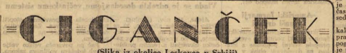
(Slika iz okolice Leskoveca v Srbiji)

Človek ne zmrzne, se ne prehladi, resno ne zboliti!