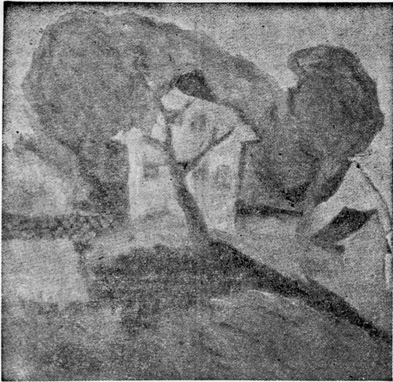
Franjo Golob: Krajina (olja)

Z razstave padlih umetnikov v Jakopičevem paviljonu