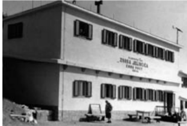
Leta 1978 je bila obnovljena fasada in dograjeno nadstropje

Leta 1926 so bila prepovedana vsa slovenska društva, kar je bil še dodaten udarec za planinska društva.