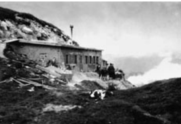
Koča na Črni prsti ob prevzemu leta 1959 PD Podbrdo