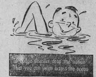
To huge disaster drop the notion that you can swim across the ocean

Sredi novih zgradb sta "palača odkritij" in velika festivalska koncertna dvorana, najlepša v Evropi. "Palača odkritij" je največja taka zgradba na svetu. S postaje podzemne železnice, ki so jo zgradili nalašč za ta del festivala, vstopi obiskovalce takoj v paviljon, ki kaže geološki razvoj in strukturo britanskega otočja v tisočletjih. Iz tega paviljona se pride v paviljon, ki