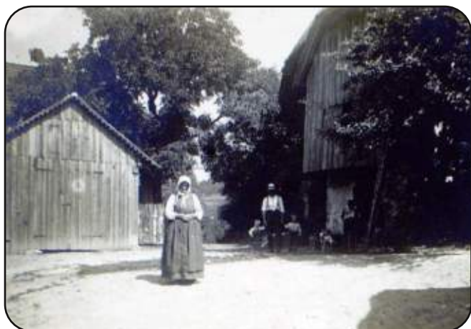
Na dvoriščiu Stritarjevega doma leta 1906