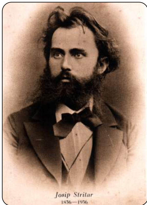
Josip Stritar 1836—1936

Prireditve sta se udeležila tudi Stritarjeva vnuka, ki sta ob tej priložnosti podarila Velikim Laščam nekaj Stritarjevih predmetov.