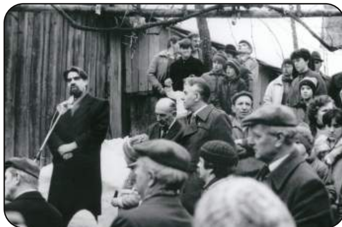
Slavnostno srečanje pri Stritarjevi rojstni hiši v nedeljo, 9. marca 1986 (foto: Niko Samsa)

Kopija razglednice, izd. leta 1936, zal. Prosvetno društvo Velike Lašče, last. J. Samsa, Dolnje Retje