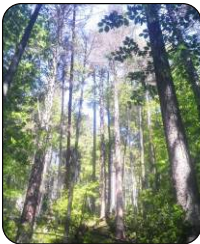
Žarišče smrekovega lubadarja— sušice (2015)

Prava eksplozija lubadarja pa se je začela konec pomladi 2015. Do konca leta smo za posek v Občini Velike Lašče označili 19.505 m 3 smreke. Stanje je bilo neobvladljivo tako za revirne gozdarje, ker fizično hkrati nismo mogli biti prisotni na več lokacijah, kjer je prišlo do izbruha smrekovega lubadarja, kakor tudi za lastnike, ki v zakonskih rokih niso uspeli posekati velikih količin lesa. Zatikalo se je tudi pri odvozu lesa, saj kupci niso uspeli pravočasno lesa odpeljati iz gozda. Zaradi tega so se žarišča širila, lastniki so se večkrat vračali na isto parcelo. Ob koncu leta, ko smo označili in posekali vsa žarišča, se je pokazalo, da so bila le-ta velika tudi po 500 m 3 . Pri tem je nastala tudi velika gospodarska škoda, cena napadenega lesa je bila tudi za 30€ na m 3 nižja kot cena zdravega lesa. Nihče ne ve točno, kaj nas čaka v letu 2016. Glede na izkušnje iz preteklih obdobij pa lahko pričakujemo še več lubadarja. Zasičenost z napadenim lesom je velika, kar se