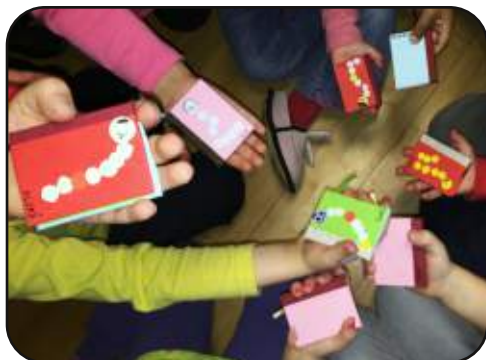
Črv Karlo na knjižicah