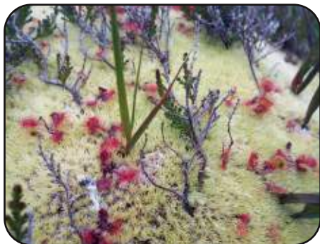
Na Irskem rastejo številne rosike med irskim mahom.