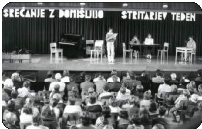
Občinsko srečanje mladih literatov Srečanje z domišljijo v velikolaški osnovni šoli, 6. marec 1986