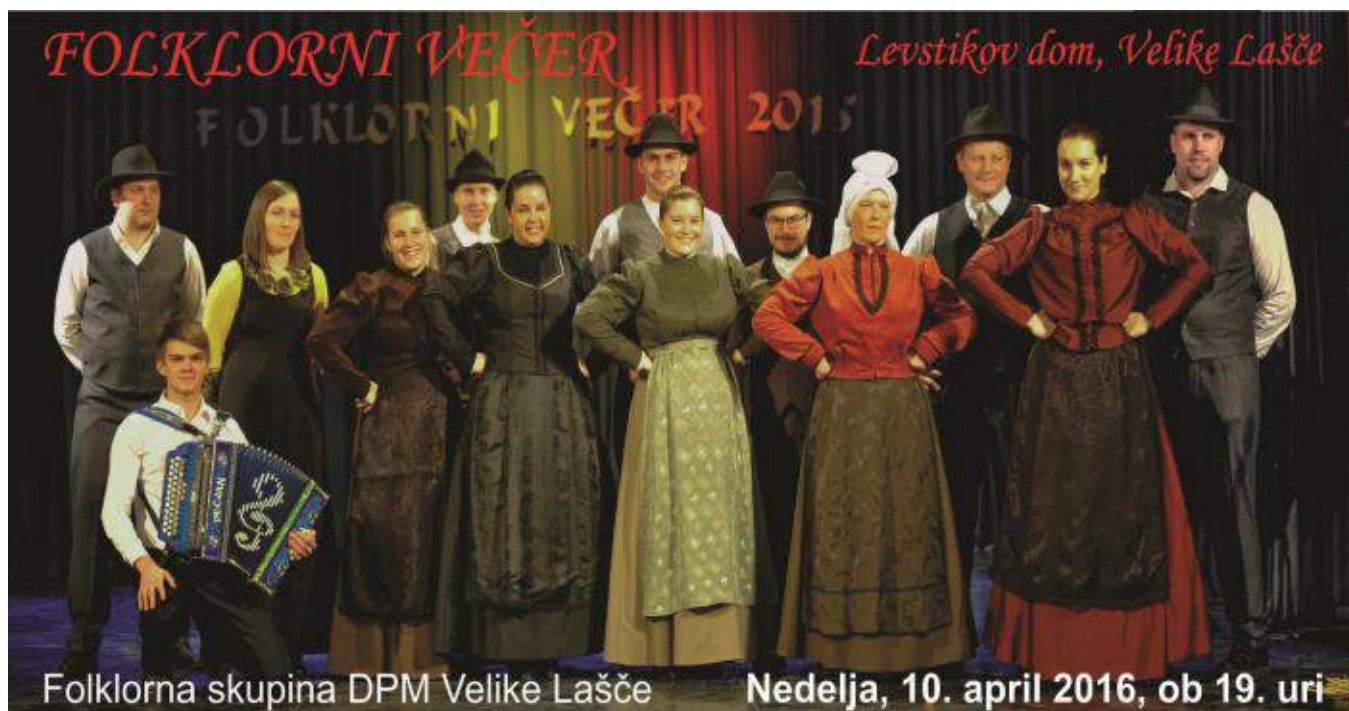
Folklorna skupina DPM Velike Lašče