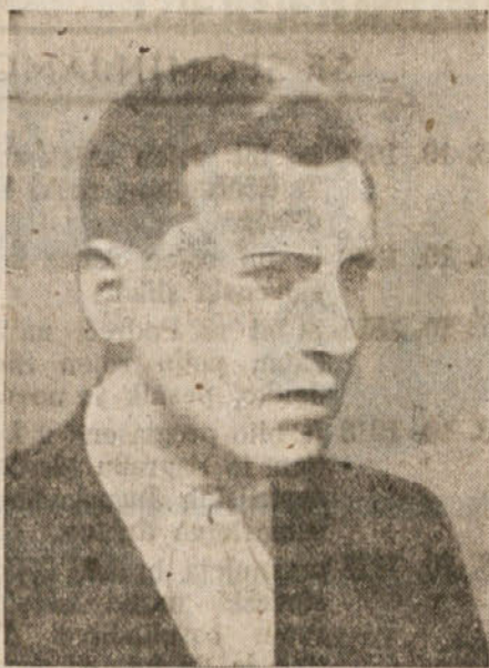
KNEZ iz Lepene