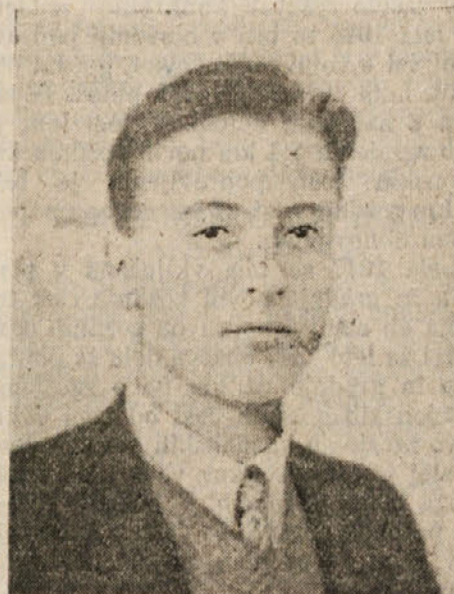
VOLBENK ŽELODEC — LADO

Maier-Kaibitsch in z njim vsi zvesti hlapci nemškega imperializma in njegovega pohlepa po slovenski zemlji zakričali v svet, da na Koroškem ni več slovenskega vprašanja ter so začeli z odkritim in brezobzirnim iztrebljanjem slovenskega naroda tu in onstran Karavank, se je vzdramilo potrpežljivo ljudstvo, ki je vedno verovalo v pravico. Spoznalo je, da bodo zatirani narodi dosegli svobodo in pravico samo z odločno borbo, v skupnem boju proti fašističnemu nasilju. Ves slovenski narod se je boril za svobodo in življenje in koroški Slovenci, ki so delili njegovo usodo, so se dvignili z orožjem v roki kot prvi in edini na velikem prostoru »tretjega rajha« in se zedinili v velikem osvobodilnem gibanju slovenskega in vseh jugoslovanskih narodov.