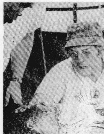
Donald Sutherland v MASH

Film kaže dogajanje v ameriški mobilni bolnišnici, strah ljudi pred obličjem smrti, pred brutalnostjo vojne. Strah privede do več črnih komedijskih situacij, k sicer izvabljajo smeh, hkrati pa silijo k razmišljanju.