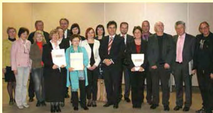
Direktorica občinskega zavoda ZTK Beltinci v družbi prejemnikov priznanj