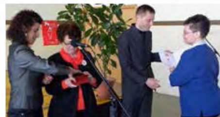
Darovala 30 krat