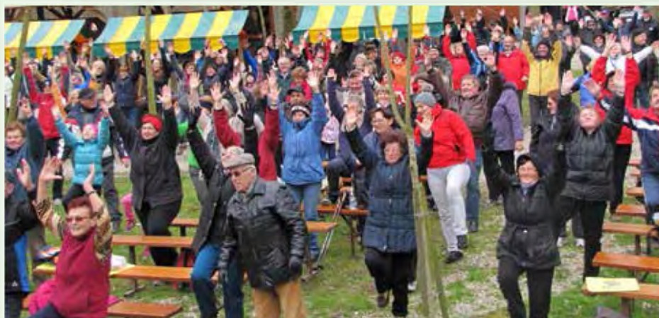
ZZV Murska Sobota Svetovni dan zdravja že tradicionalno obeležuje na Otoku ljubezni v Ižakovcih

Promovirali smo zdrav življenjski slog, telesno aktivnost in zdravo prehrano. Kljub mrzlemu vremenu so prišli pohodniki in kolesarji iz različnih krajev Pomurja.