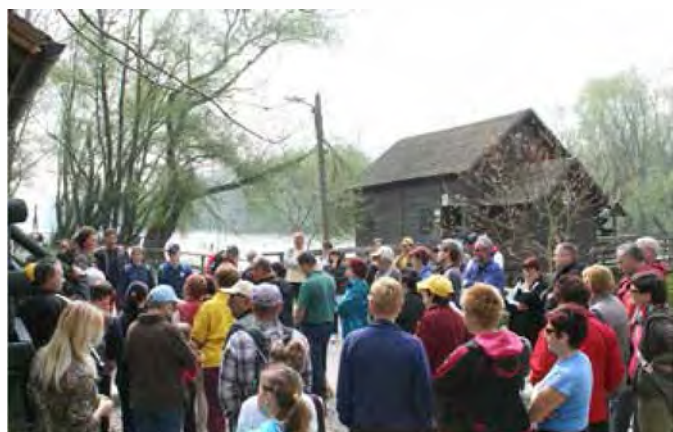
VII. POHOD OB DNEVU ZEMLJE v organizaciji ZTK Beltinci in Zavoda za gozdove, OE Murska Sobota je ob lepem sončnem vremenu ponudil obilo užitkov številnim udeležencem tradicionalnega pohoda