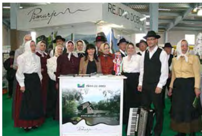
Zavod za turizem in kulturo Beltinci skupaj s KUD Beltinci na sejmu LOV IN NATURO v Gornji Radgoni od 19.04. do 21.04.2013