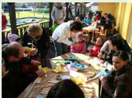
Otroci so skupaj s starši in vzgojitelji pozdravili pomlad na ustvarjalnih delavnicah

V kotičkih ustvarjalnih delavnic so otroci skupaj s starši in vzgojitelji izdelovali zajčke iz tulcev, čebelice iz embalaže kinder jajčk, vetrnice, ki so jih otroci takoj preizkušali na igrišču, barvali jajčke iz kartona in izdelovali košarice iz