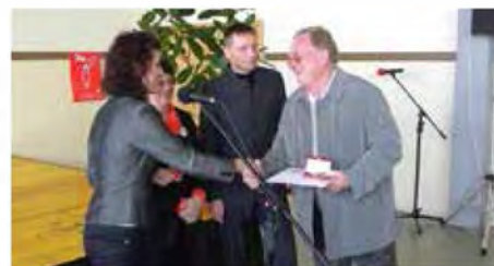
Daroval 70 krat