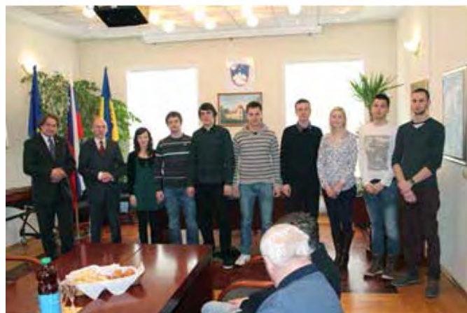
Študentke in študenti Občine Beltinci na slavnostnem podpisu pogodb o štipendiranju