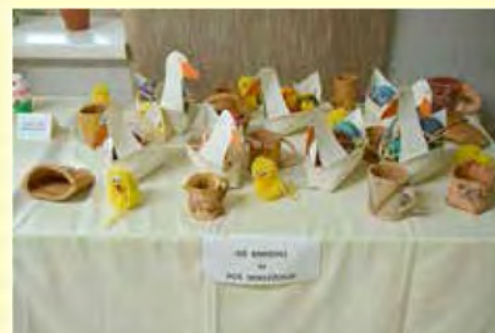
Na velikonočni razstavi v Dokležovju so bili na ogled tudi zanimivi izdelki učencev, ki so jih ustvarili skupaj s svojimi mentorji

Ob odprtju velikonočne razstave smo pripravili krajši kulturni program, na katerem se je zbralo lepo število obiskovalcev. Razstava je bila na ogled od 27. 3. do 2. 4. 2013 in je požela veliko pohval ter zanimanja. Zagotovo smo s tem dosegli svoj namen, saj se v društvu trudimo, dana ta način pričarano simboliko preteklosti in jo vključimo v sodobni čas. Upamo in želimo, da bodo običaji in šege naših dedkov in babic ostale žive tudi našim zanamcem. Mladim moramo privzgojiti pravilen odnos do bogatih običajev, ki imajo globoke korenine. Letošnji velikonočni prazniki