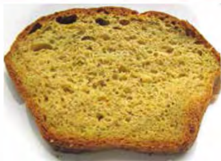
Slasten in zdrav korenčkov kolač za skupni družinski obrok

Ste vedeli, da skupni družinski obroki prinašajo več zdravja vsem članom družine? Za to imamo danes čvrste dokaze. Ne nazadnje, ali je kaj lepšega kot družina, zbrana za mizo? Tisti, ki imamo redne skupne obroke, obdržimo to dobro navado in tradicijo. Če smo med tistimi, ki večinoma nimajo skupnih družinskih obrokov, poskušajmo postopno narediti spremembo. Da bo vse skupaj lažje, zanimivo, prijetno in zabavno, vključimo vse člane družine, tudi otroke.