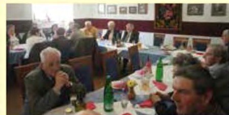
Utrinek z volilnega zbora članov KO ZZB NOB Beltinci

Tratnjek v marcu 2013 slavil visok jubilej, 100 let življenja. Člani smo ga skupaj s KS Lipovci obiskali na njegovem domu, mu čestitali in ga skromno obdarili.