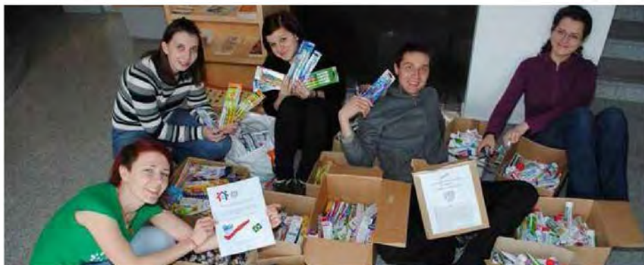
V Društvu prijateljev mladine Beltinci se radi odzovemo klicu na pomoč