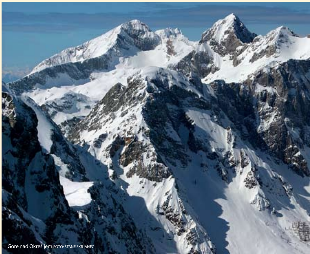
Gore nad Okrešljem

Po skoraj desetih letih, ko so bile nejasnosti glede izvajanja agrarne reforme odpravljene, so 12.