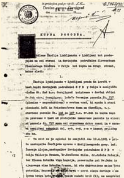
Kupna pogodba iz leta 1931

in odprli planinsko postojanko, ki so jo poimenovali Frischaufov dom na Okrešlju.