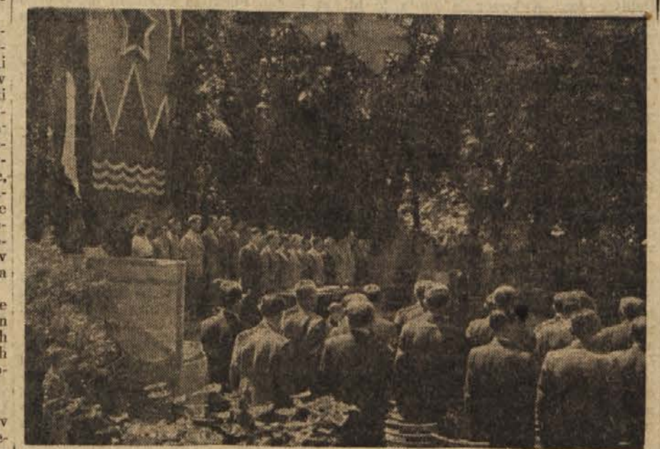
Počastitev spomina padlih borev za svobodo z enominutnim molkom