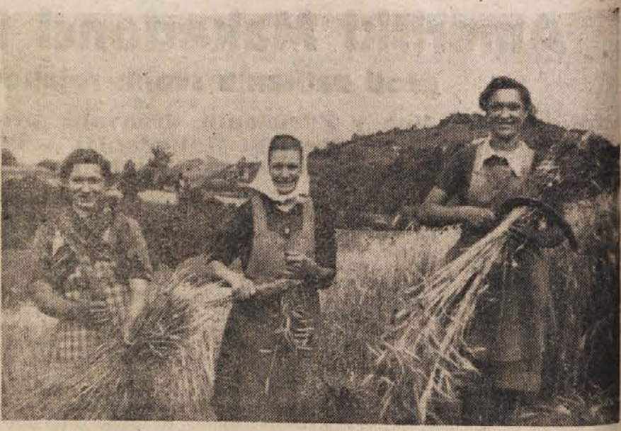
Pridne roke naših kmečkih deklet in žena so pospravile zlato klasje

Okrožni, okrajni in krajevni odbori, Partijski komitete, vse ustanove in uradi se opozarjajo, da bodo prejimali »Borbo« samo odslej prijavljeni naročniki. Naročnina se bo plačevala na čekovni račun.