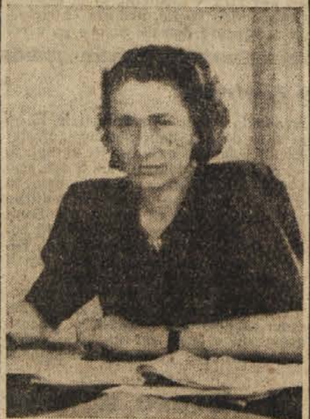
Minister za socialno politiko tov. Vida Tomšičeva

za socialno skrbstvo dela v tesnem stiku s sindikalnimi organizacijami svojega kraja, okraja ali okrožja. Sindikalne organizacije, skupno s socialnimi referenti vsužejo zadeve, ki se morejo rešiti v njihovem okviru oziroma dajejo iniciativo za določene rešitve svojemu glavnemu odboru oziroma ministarstvu.