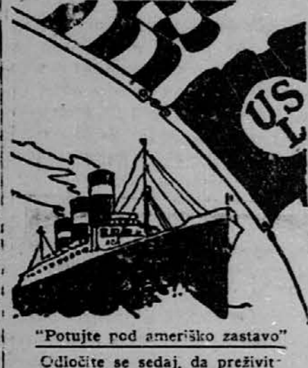
"Potujte pod ameriško zastavo"

Havre; Stuttgart, Cherbourg, Bremen. 17. marca: Deutschland, Cherbourg, Hamburg. 18. marca: Aquitania, Cherbourg. 19. marca: Leviathan, Cherbourg; Bremen, Cherbourg, Bremen. 22. marca: Pres. Wilson, Trst; Columbus, Cherbourg, Bremen. 23. marca: La Savoie, Havre; George Washington, Cherbourg, Bremen. 24. marca: Cleveland, Hamburg. 25. marca: Olympic, Cherbourg; Republic, Cherbourg, Bremen. 30. marca: Pres. Harding, Cherbourg, Bremen. 31. marca: Suffren, Havre; Hamburg, Cherbourg, Hamburg; Berlin, Cherbourg, Bremen. 2. aprila: France, Havre — SKUPNI IZLET 14. maja: SKUPNI IZLET s parnikom PARIS 2. julija: SKUPNI IZLET z novim parnikom ILE DE FRANCE.