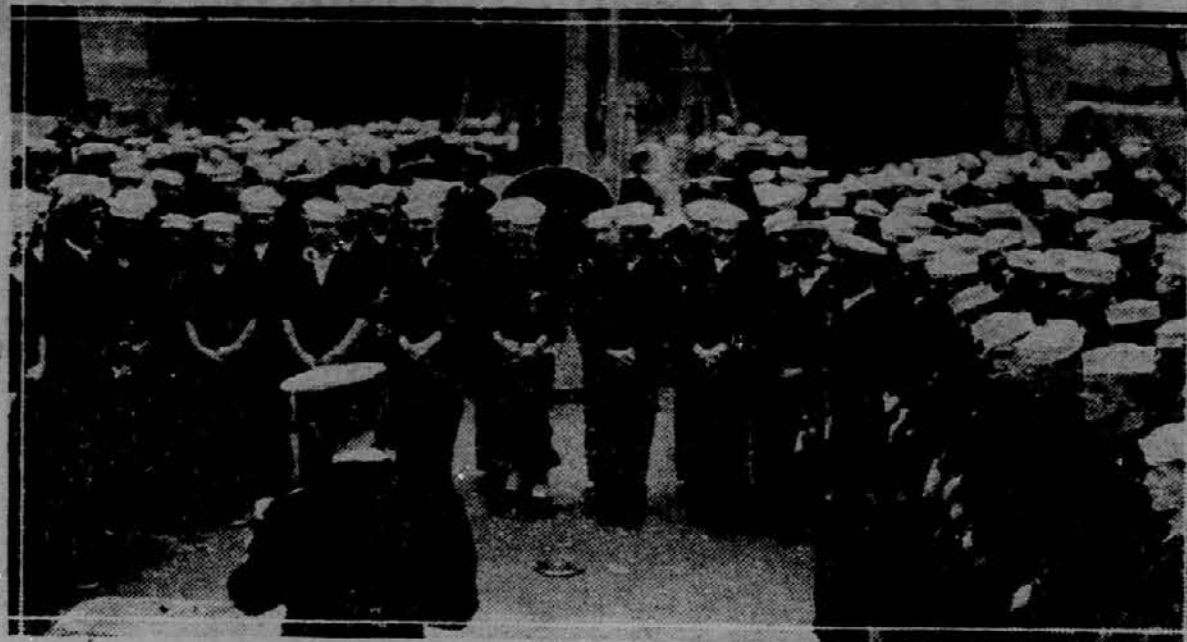
Na ameriški bojni ladji "Memphis" so se vršile streljalne tekme. Skoro vsi mornarji so se izkazali kot dobri strelci. Najboljši med njimi so pa dobili denarno nagrado.

Hlapec je šel počasi, zatopljen v misli in glavo je imel na gnjeno. Mogoče je sploh še ni zapazil. Na desni in levi od cest so bila nagromadena drva. Zapustila je glavno cesto ter odšla v kritju nagromadenih drv nazaj, odkoder je prišla. Njeni pogledi so nekaj iskali in tedaj je videla naenkrat, v svoje veliko presenečenje, da je Herbert že jahal v gozd. Obrnila se je nazaj ter zapazila hlapec, ki se je ravno skrival za neko skladovalnico.