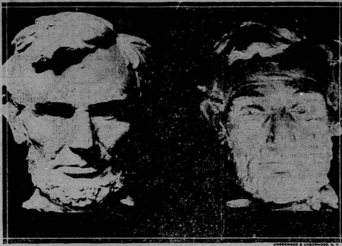
To sta dve fotografiji Lincolnove glave na spomeniku v zveznem glavnem mestu. Prej je bil spomenik ponoči slabo razsvetljen, kot je razvidno iz desne slike. Leva slika je bila pa vzeta v novi razsvetljavi.