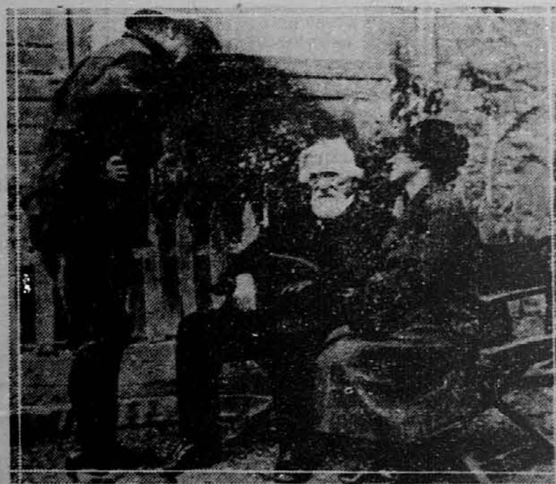
Slavni ameriški iznajditelj Hudson Maxim se mudi s svojo ženo v Hollywood, Cal. Poleg njega stoji njegov prijatelj commodore J. Stuart Blacton.