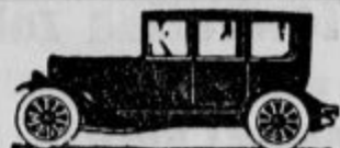
Model 56 zapri

GLAVNO ZASTOPSTVO ZA SHS: ELASTO D. D. ZAGREB, BOSKOVICEVA UL. 8