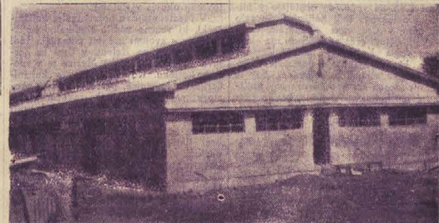
Del nove tovarne montažnih hiš v Zavidovičih

Tovarna bo lahko kmalu vsaki dve uri izdelala po eno hišo s pohištvo vred. Njeno obratovanje bo velik napredek v dviganju življenjskega standarda naših delovnih ljudi in še ena velika zmaga v izpolnjevanju Titove petletke. (Po »Radu«)