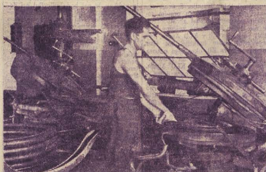
Vulkanizacija kolesnih plaščev v obročnih stiskalnicah v tovarni »Sava« — Kranj