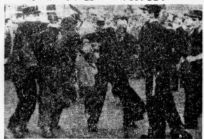
Ob zadnjih demonstracijah francoskih študentov, ki so v Parizu protestirali proti nezadostnim državnim kreditom za vzgojo in prosveto, je prišlo do resnih spopadov s policijo, pa tudi do žrtve.