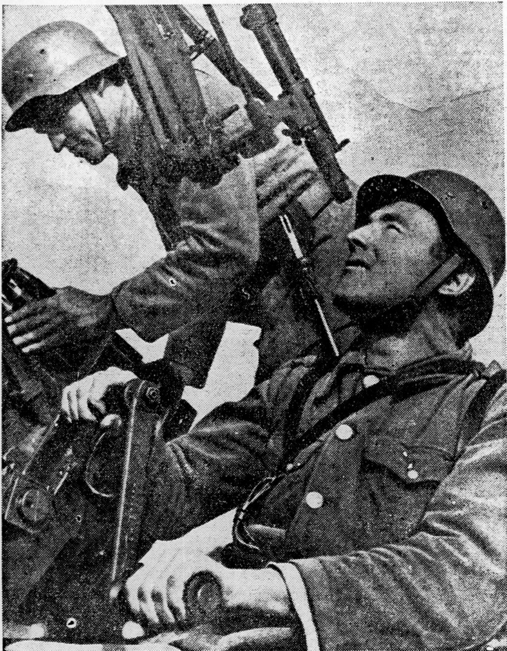
Vsem pripadnikom JLA k njihovu prazniku naše čestitke!