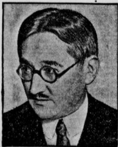
Francoski trgovinski minister Lamoureux pojde v Moskvo, da bi dosegel večjo trgovsko živahnost med Rusijo in Francijo.