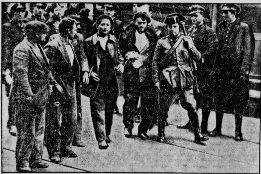
Španske upornike, ki so jih vjeli v bojih v asturskih gorah, vodijo v ječe

O zaduženosti revoluciji in uporu na Španskem, ki tli samo še v gorah Asturije, je priobčil belgijski list »Libre Belgique« od svojega posebnega poročevalca, ki je bil priča vseh dogodkov, tole poročilo: