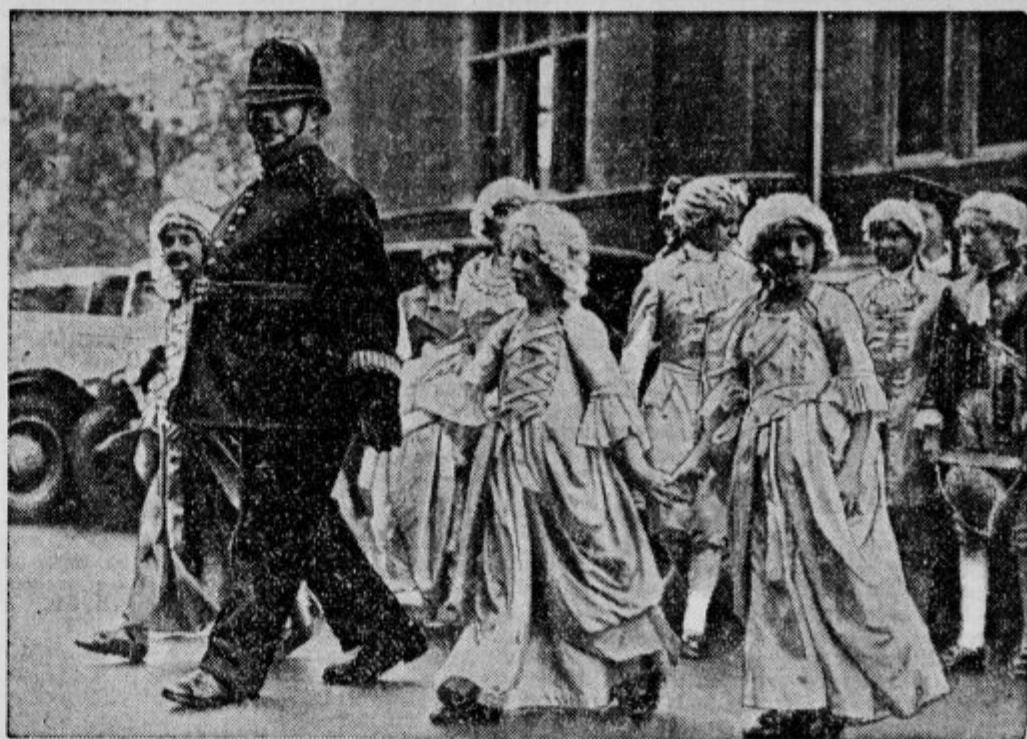
Noša rokoko v l. 1934. Angleška princezinja Alica je priredila dobrodelno otroško zabavo v kostumih. Del otrok je šel na zabavo v noši iz dobe rokokoja. Mlade fantiče in deklice spremlja čez nevarne londonske ulice resni stražnik.