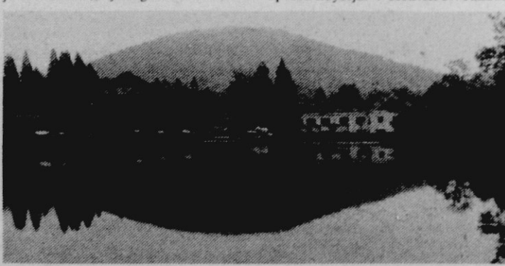
Hotel Bor in grad Hrib