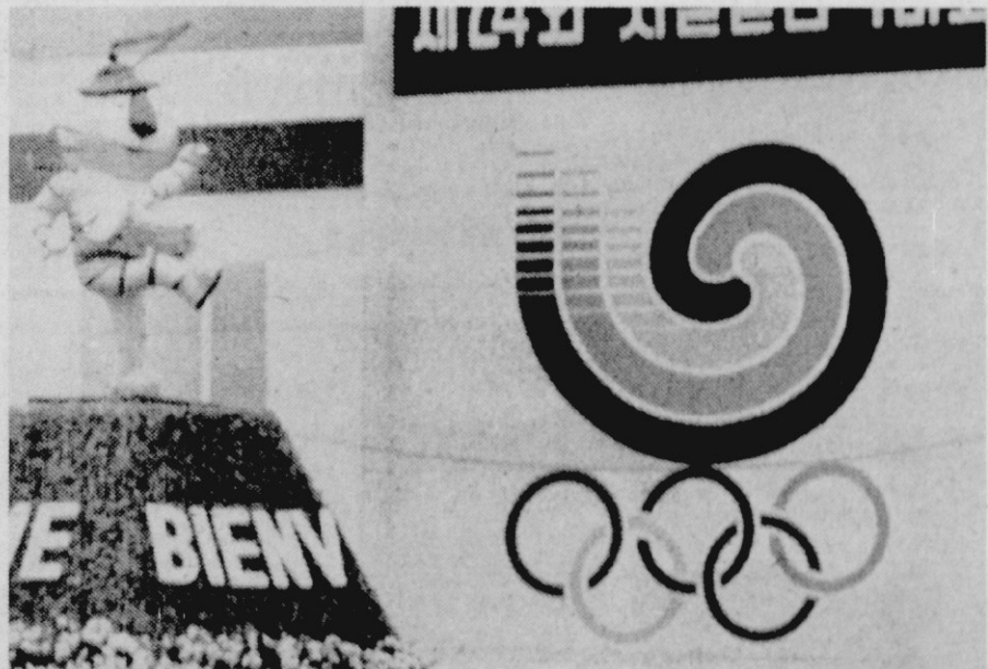
Prijazni tigrček oranžne barve z modrimi črtami je maskota letošnjih poletnih OI. S piramide pred mestno hišo pozdravlja prihajajoče športnike.