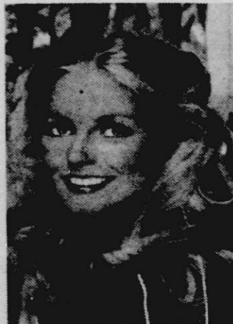
Igrajo: Cheryl Ladd, Sam Elliott, Alexis Smith, Fritz Weaver

Nadaljevanka ima štiri dele. Režija: Delbert Mann