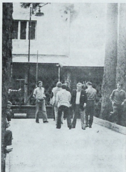
Balinarji se dogovarjajo

27. septembra so začeli delavci našega sektorja za vzdrževanje pripravljati parkirišče na južni strani kolesarnice. S tem bo rešen problem parkiranja vozil naših delavcev. Najprej bo parkirni prostor nasut s peskom, kasneje pa bo asfaltiran in narejena bo kanalizacija