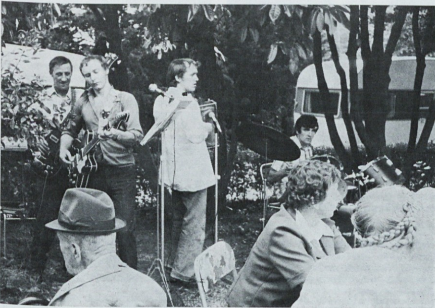
Za veselo vzdušje ...

V letu 1977 smo poleg penzionov za člane naše DO, ki jih je bilo 2571 imeli še 1079 penzionov nečlanov naše DO. Ti so napolnili dom predvsem v obdobju pred 19. junijem in po 21. avgustu. Zasedli pa so tudi proste sobe, ki so jih naši delavci kljub rezervacijam odpovedali (izgovori drugačni kot vzrok — slabo vreme).