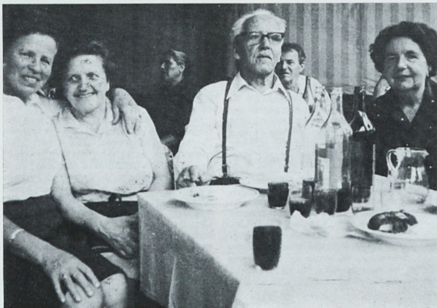
Radi se imamo ...