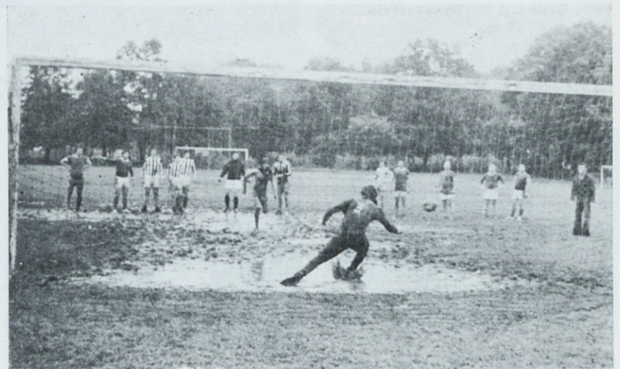
Kljub neugodnemu vremenu in razmočenemu (blatnemu) igrišču, so se naši fantje veselili obrazov metali po lužah ...