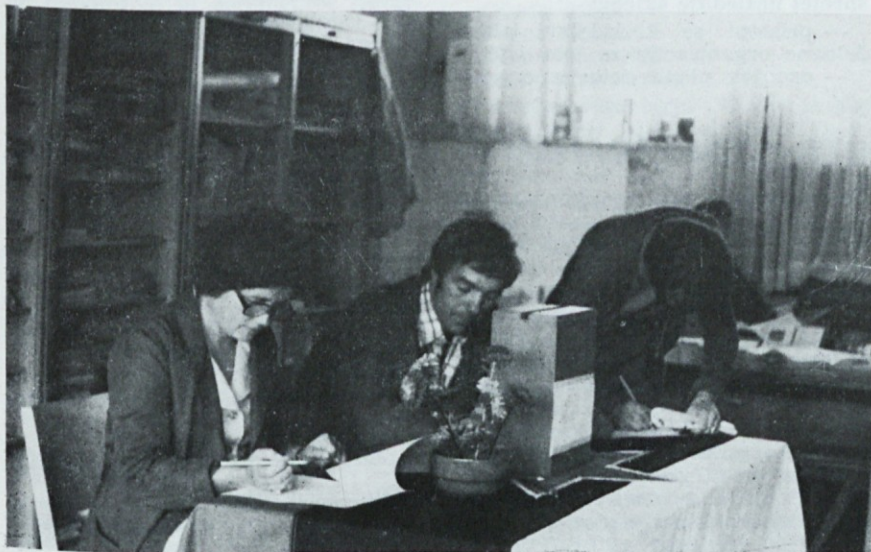
Volilna komisija za referendum pri delu

Dne 16. 9. 1977 so se delavci OE vzdrževanje in investicije na referendumu odločili o predlogu sklepa za organiziranje TOZD Vzdrževanje in investicije ter energetika. Predlog o organiziranju cit. TOZD je bil sprejet na zboru delavcev OE vzdrževanje in investicije z večino glasov vseh delavcev te OE dne 1. 9. 1977.