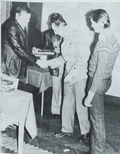
Tudi strelci Induplati — 1. mesto