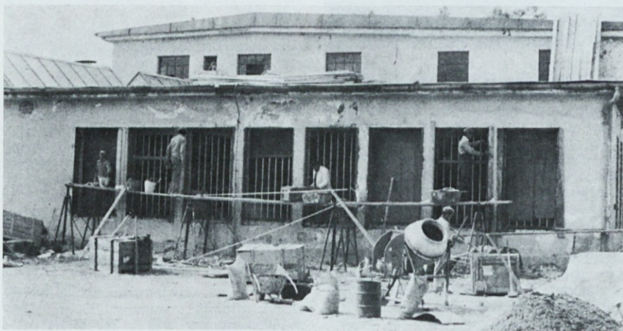
Zamenjava oken v pregledovalnici blaga je bila izvršena v rekordnem času in sicer v dveh dnevih (22. in 23. septembra 1977)