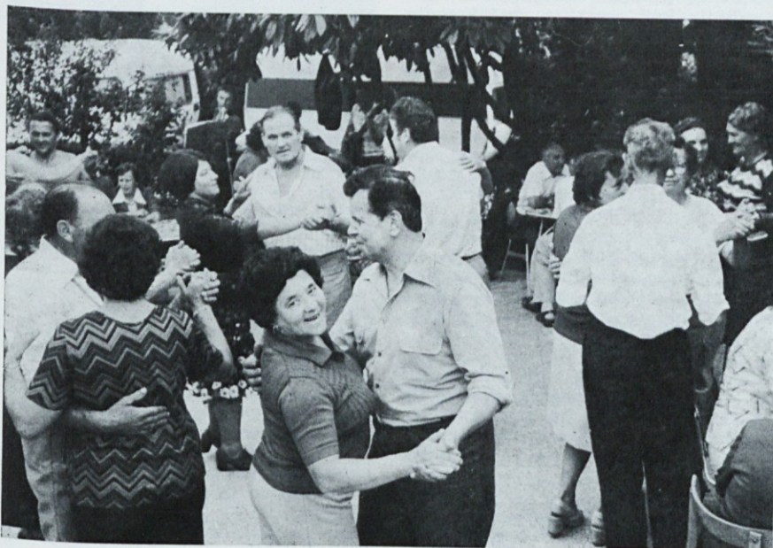
Nekateri so se korajžno zavrteli

Ne smemo tudi pozabiti zasedbo doma v juniju s šolo v naravi (100 šolskih otrok).