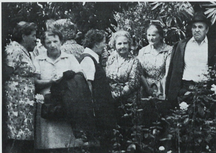
Spet smo se zbrali ...

Po kosilu so se nekateri odpeljali na ogled Poreča, nekateri pa v Novi grad.