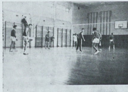
Odbojkaši pred akcijo

SKUPNI PLASMA: 1. Induplati Jarše 18 točk, 2. Svilanit Kamnik 17 točk, 3. Stol Duplica 8 točk.