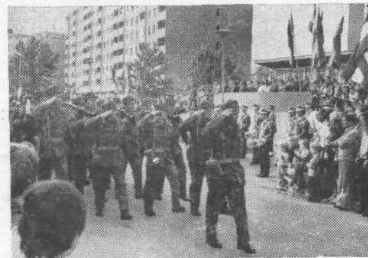
Prizor z lanskoletne parade

Naslednje leto bo minilo že trideset let odkar so s skromnimi sredstvi, toda z odločno voljo začeli z delom zavoda.