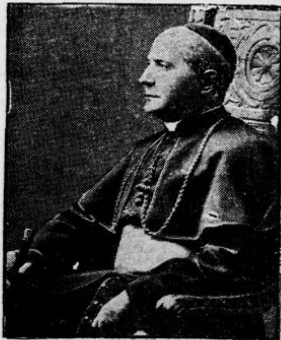
Kardinal Francesco Rognoni,

prefekt vatikanskega kasacijskega dvora, je umrl na pljučnici star 81 let. Z njegovo smrtjo se je znižalo število kardinalov na 56.