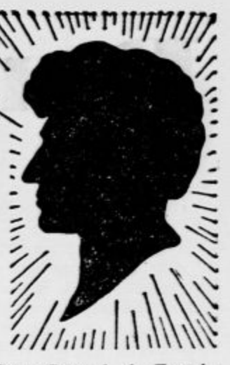
Repr. Rave d. d., Zagreb

SCHWARZKOPF-EXTRA SCHAUMPON s PRAŠKEM HAARGLANZ