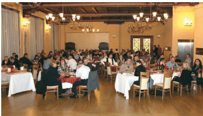
Dvorana v Jamskem dvorcu v Postojni je bila polno zasedena.