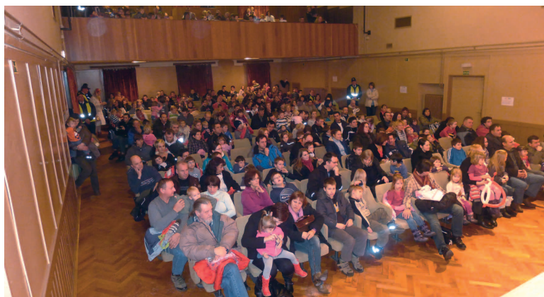
Polna dvorana otrok s starši