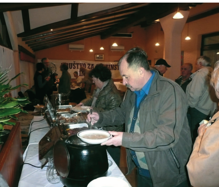
Pred kotličem z joto: to velja poskusiti!