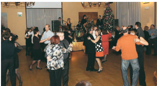
Udeleženci srečanja med plesom.