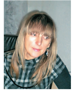
Pripravljala Silva Šivec