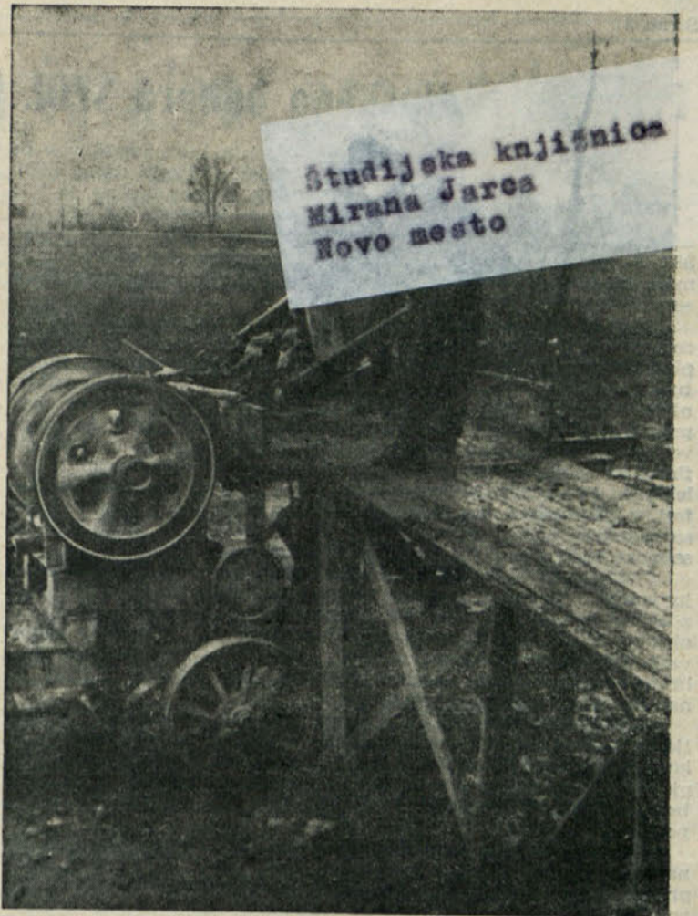
Za ureditev cest je potrebno veliko gradiva. Drobilci v kamnolomih hitijo mleti kamen, ki predstavlja osnovno podlago za dobro cesto

Izkušnje, ki smo jih v zatiranju malarije dobili pri nas, so potrdile prepričanje, da je malarijo mogoče povsem izkoreniniti, če sodeluje vsa zdravstvena služba. Računamo, da bodo do leta 1963, popolnoma zatrti to nekdanj nevarno bolezen.