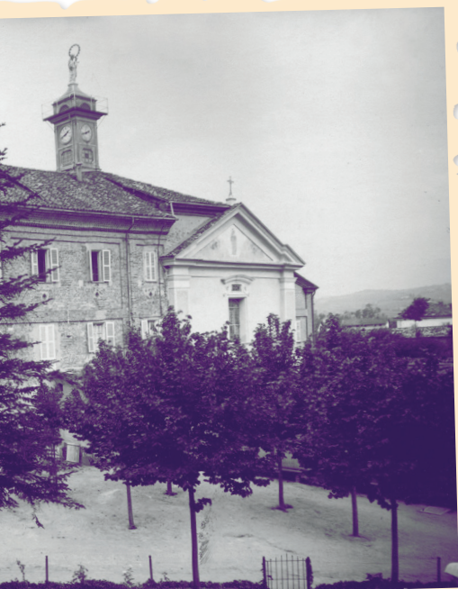
Zavod v Nizzi Monferrato

3. maja 1977, ko je umrla, se je zdelo, da je ves vrt eksplodiral v cvetju, da tako pozdravi njo, ki mu je posvetila toliko let neutrudnega dela.