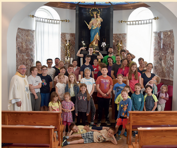
Šmarničarji poromali v Veržej // Skupina otrok in staršev iz župnije Maribor sv. Janez Bosko se je ob zaključku šmarnic podala na izlet in med drugim poromala tudi k Mariji Pomočnici v Veržej, kjer so obhajali sveto mašo in se okrepčali.