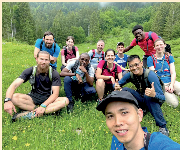
Srečanje mladih redovnikov // 10. junija so si mladi redovniki in redovnice zamislili prav posebno srečanje: odpravili so se na pohod na selško Zabreško planino, kjer so občudovali naravo, se bogatili v različnosti karizem in se veselili v druženju.