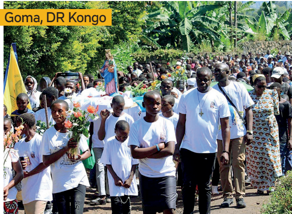
Goma, DR Kongo