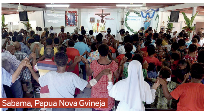
Sabama, Papua Nova Gvineja