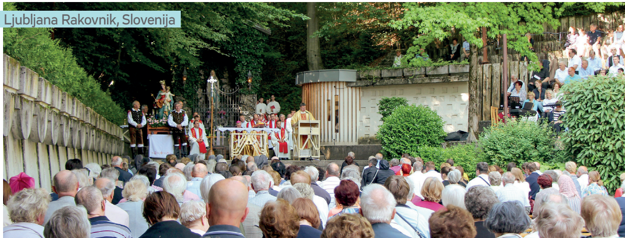
Ljubljana Rakovnik, Slovenija