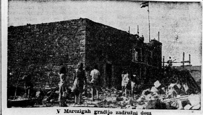
V Marezigah gradijo združni dom

Načrtna gradbena delavnost v jugoslovanskem pasu Svobodnega tržaškega ozemlja ima dobre pogoje zaradi odličnih istrskih zidarjev in dobrega gradbenega materiala istrskih kamnolomov. Proizvodnja po vseh istrskih kamnolomih in opekarah so močno povečali in s tem