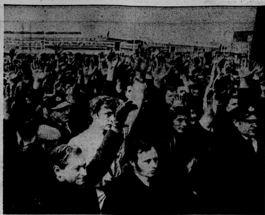
NEMIRNI HEATHROW — V zadnjih dneh je veliko londonsko letališče zelo nemirno. Najprej ga je stresla burja, ko delavci niso marali oskrbovati izraelskih in arabskih letal, potem pa so zagrozili s stavko gasilci, ki so zahtevali višje plače. Včeraj so za stavko takoale glasovali nakladarji potniške prijatje, ki so za nekaj ur zadržali polete iz Londona v New York. A tudi gasilskega nemira še ni konec.