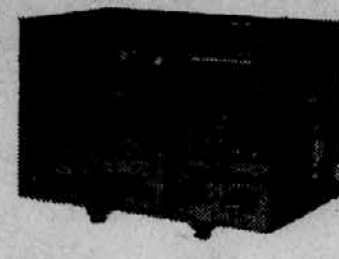
Ročni varilni električni stroji