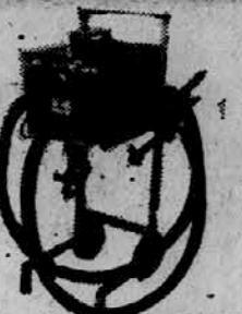
Vrtalni stroji za karoserije

in vsi drugi stroji ter orodja za mehanične delavnice, avto delavnice in elektro avto delavnice.