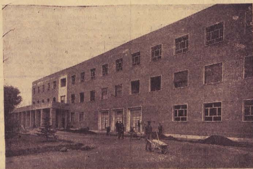
Poslopje nove bolnišnice za kostno tuberkulozo v Šempetru pri Gorici