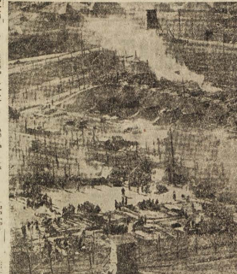
Severnokorejci, ki so odklonili repatriacijo, so zažgali pred odhodom ujetniško taborišče

canje ženevske konference o Koreji in Indokini pomeni uspeh miroljubnih sil, ki so zainteresirane na popuščenju mednarodne napetosti. Vendar časnik pričakuje, da agresivne sile na Zahodu ne bodo štedile s trdom, da bi zavrijo uspešno delo konference in sicer tako, da ne bi mogla sprejeti konkretnih sklepov. Časnik piše, da v azijskih deželah