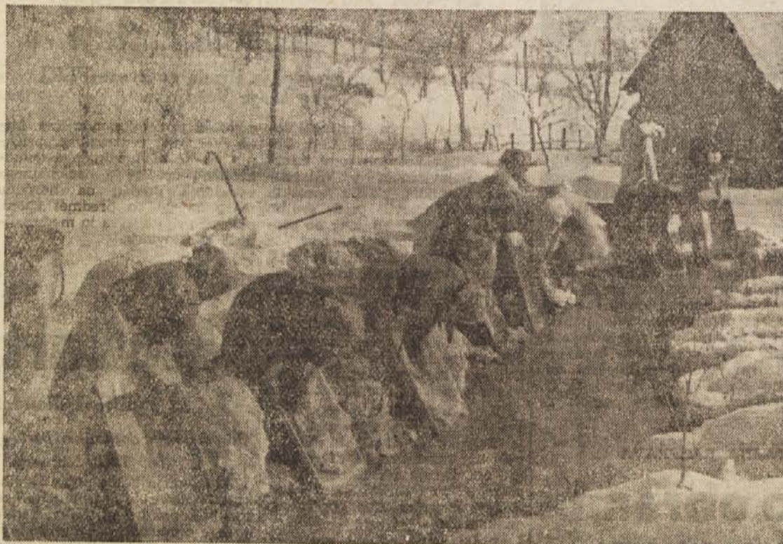
Pozimi na podeželju: vaške perice ob potoku

segli ob ugodni pomladi — vlage pa je v zemlji že dovolj — malone normalen donos.