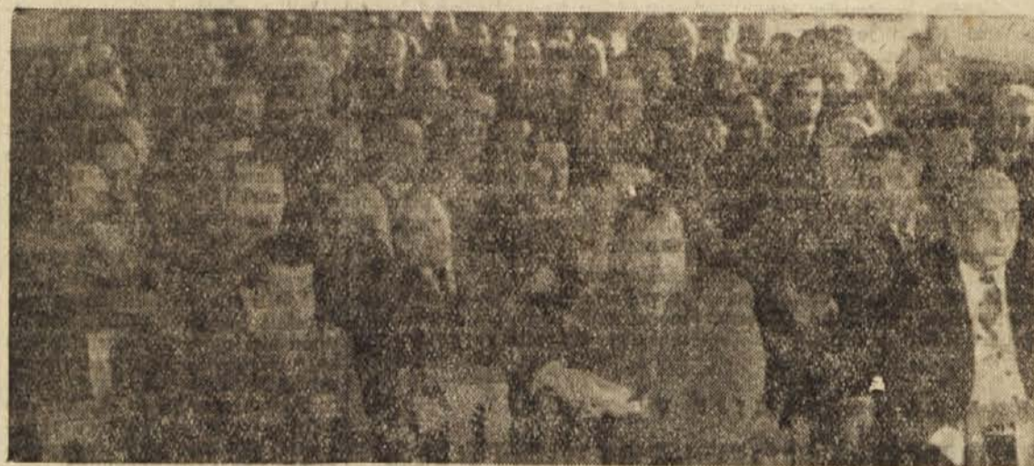
8 skupne seje gospodarskih in proračunskih odborov Zvezne ljudske skupščine