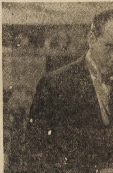
Prizor iz filma »Oženil sem se s čarovnico«