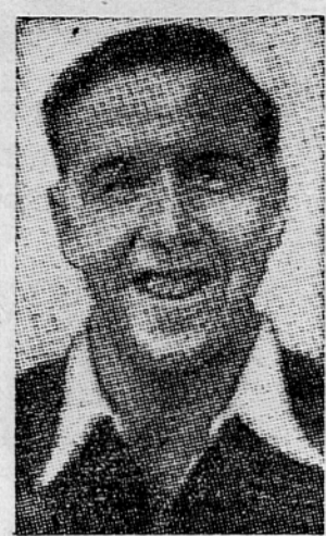
Wilf Mannion, desna zveza angleškega napada