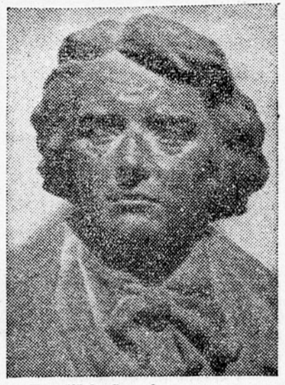
Francišek Smerdu: Dr. France Prešern

Prav tako pomembna prijava je tudi v četrtem oddelku, kjer je pred Krstom pri Savici natisnjen tudi Uvod. V celoti je torej s to izdajo močno izpopolnjena podoba pesnika Prešerna v srbskih prevodih. Po obsegu je knjiga prepresnitev narasla skoraj za polovico, pa tudi vrednost na novo prevedenih pesmi (razen nekaj izjem) ne zaostaja veliko za že prej prevedenimi. Zaradi tega se naravnost vsiljuje po-