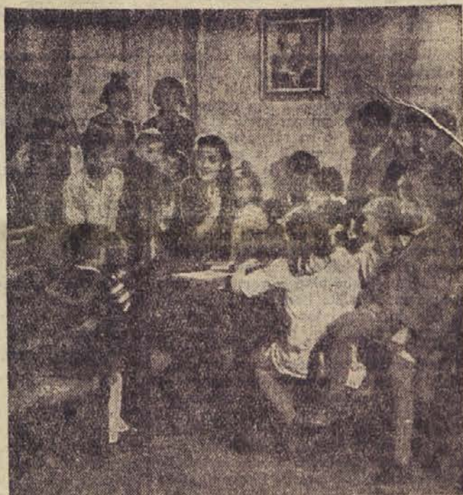
Cicibanov kotiček na Prulah

»Čudo, prečudno! Res pojejo meni! »Ciciban, Ciciban!« slišim ves čas, drobno kot ptičke na veji zeleni: »Ciciban, tebi zlat kujemo čas!«