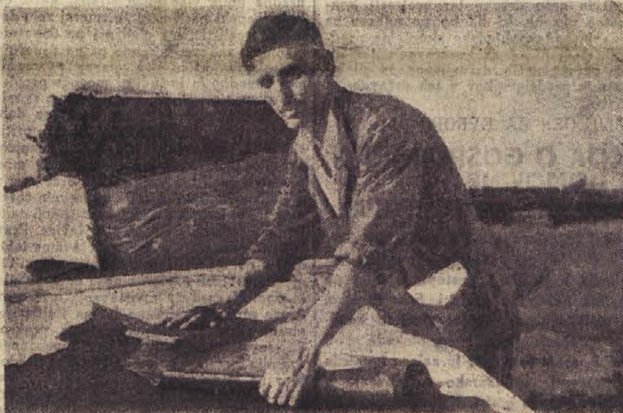
Mojster Novak pri izdelovanju »safijanc« usnja

lanterijsko blago. Kot rečeno, je mojstru Špendau njegov poizkus uspel. Doslej je izdelal z eno samo ploščo, ki jo ima na razpolago in ki ima odliče kače ter kuščarja, kože v desetih različnih barvah.