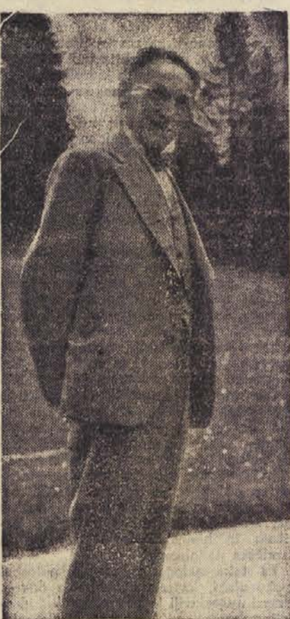
Oton Župančič na Bledu l. 1938

Cankarjeva založba, založnica dopolnjenega zvezka k Delom, se je potrudila, da bo knjiga glede na zunanjo in notranjo opremo posnetka natanko po predvojni izdaji. Tako bo novi Župančičev zvezek zaključil zbirko in bo s prejšnjimi zvezki vred nudil zaokroženo podobno bogate pesnikove stvaritve. Seveda je naloga našega založništva, da čimprej oskrbi kritično izdajo celotnega Župančičevega opusa. Knjiga, ki se pridružuje kot peti zvezek k Delom, obsega v glavnem Zimzelen pod snegom in Veš, poet, svoj dolg? Razdeljena je v dva dela: pesniški in prozni. V prvem delu sledi celotnemu Zimzelen pod snegom skupina pesmi z naslovom Zadnje pesmi, ki so vzete bodisi iz knjige Veš, poet, svoj dolg?, bodisi iz revij. Prozni del obravnava razdelitev v dve skupini, kakor jo ima knjiga Veš, poet, svoj dolg?, z naslovoma Kultura in novi čas in Politični govori in članki. Prva skupina je pomnožena s sedmimi proznimi sestavki. Med