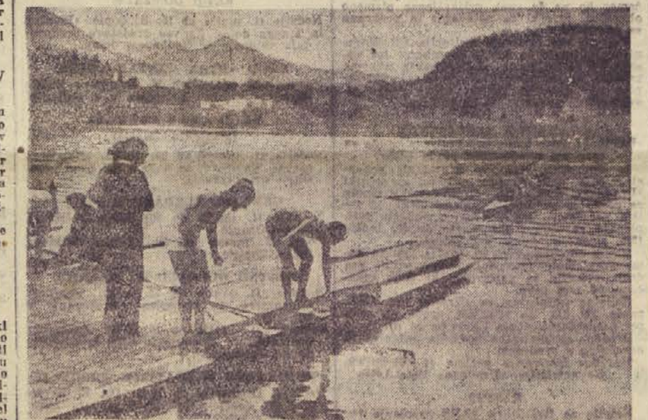
Mednarodna regata na Bledu bo danes ob 15. uri. — Slika prikazuje naše tekmovalce na večeršnjem treningu