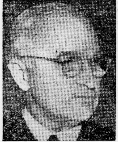
Predsednik britanske vlade Winston Churchill

London, 28. dec. (Tanjug) Ministrski predsednik Winston Churchill bo v soboto odpotoval v ZDA. V Churchillovem spremstvu bodo zunanji minister Eden, minister za zadeve Britanske skupnosti narodov lord Ismay, zastopnik finančnega ministrstva lord Cherwell ter več uglednih funkcionarjev zunanega in finančnega ministrstva. Churchill bo ostal v Ameriki štiri dni.