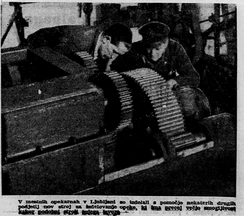
V mestnih opekarnah v Ljubljani so izdelali s pomočjo nekaterih drugih podjetij nov stroj za izdelovanje opeke, ki ima precej večjo zmogljivost kakor podobni stroji iz drugega časa.