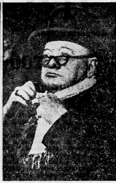
Predsednik britanske vlade Winston Churchill

Glede imenovanja dveh svetovalcev kralja Faruka, ki sta znana po svojem prijateljskem stališču do Velike Britanije, sodijo v Londonu, da je to znamenje nekoliko zmernejšega kurza egiptovske politike. Britanski tisk ima oba nova svetovalca za britanska prijatelja, ki bi lahko močno vplivala na kralja Faruka, s tem pa tudi na vladno politiko.