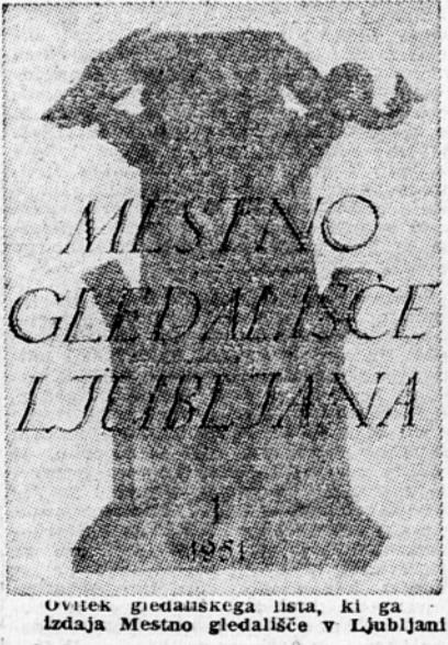
Ovitek gledališkega lista, ki ga izdaja Mestno gledališče v Ljubljani