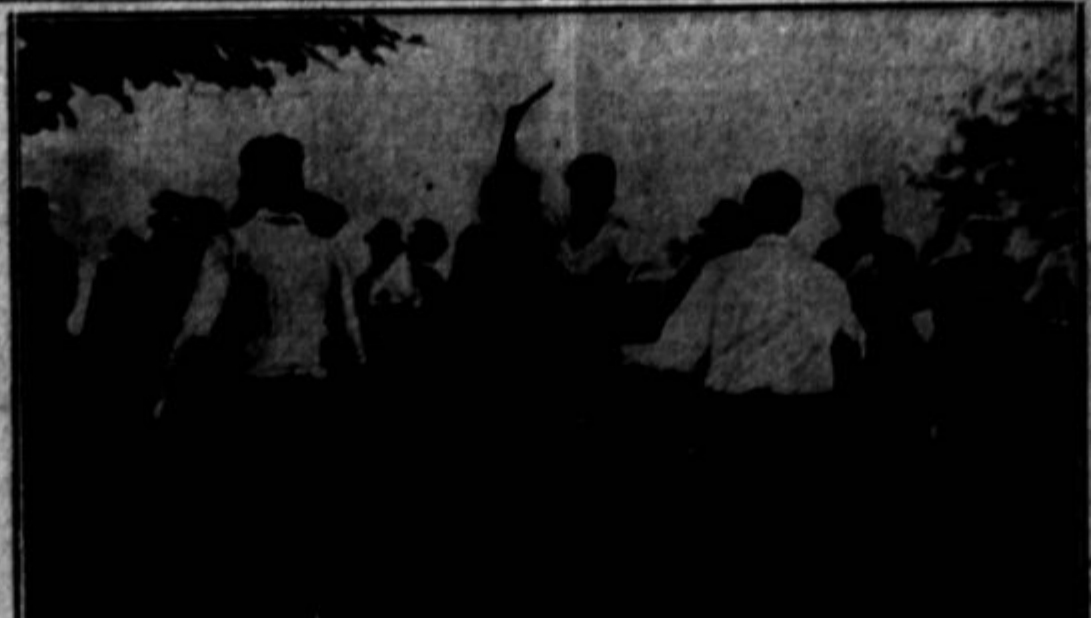
Konflikt med policijo in komunisti v Harbertonu, O., kjer so policaji metali bombe s plinom za solzenje v množico.

Stavka proti General Fabrics Co. traja že od 8. maja. Krog 800 delavcev je pustilo delo, ko jim je družba reducirala mezdo in uvedla nove metode priganjstva.