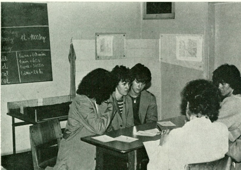
Lepši del ekipe odgovarja na vprašanja iz triaže