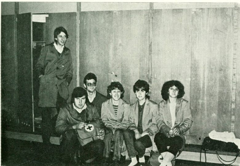
Člani naše ekipe željno čakajo na začetek tekmovanja