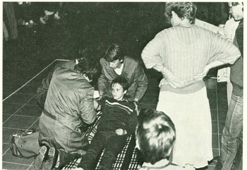
Moški del ekipe ni pod strogimi očmi ocenjevalne komisije naredil nobene napake in jo prepričal, da je najboljši