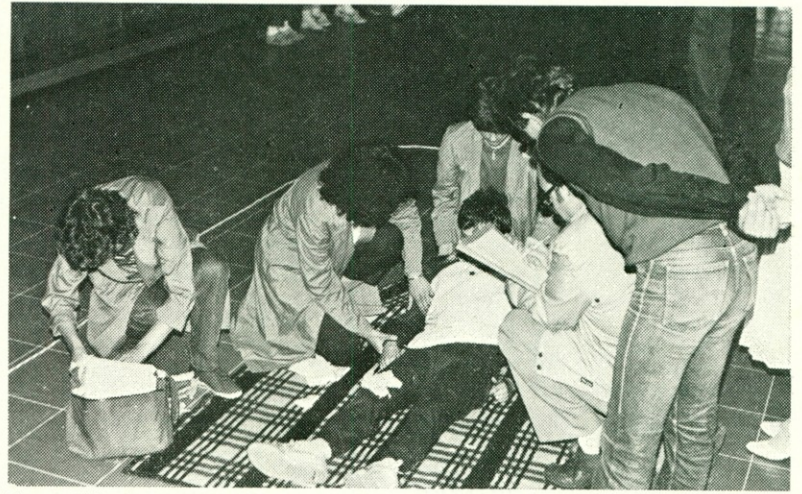
Teoretično znanje iz triaže se mora dopolnjevati s praktičnim delom, z oskrbo ponesrečenca