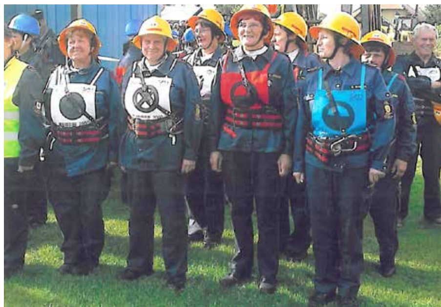
Štorske veteranke so osvojile na državnem prvenstvu v Ormožu visoko 4. mesto med 45-imi ekipami