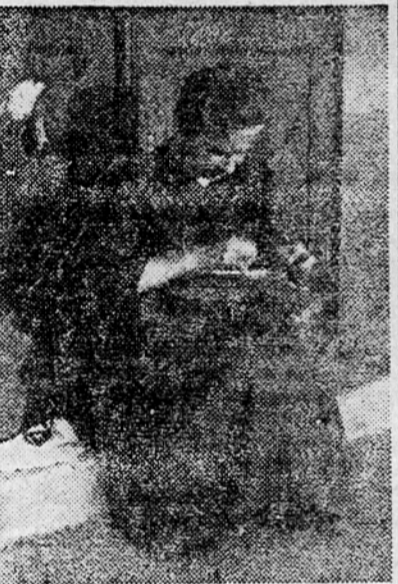
Čipkarica dela na ulici pred svojim domom

nikakega pohištva; saj pa tudi ni potrebnega.