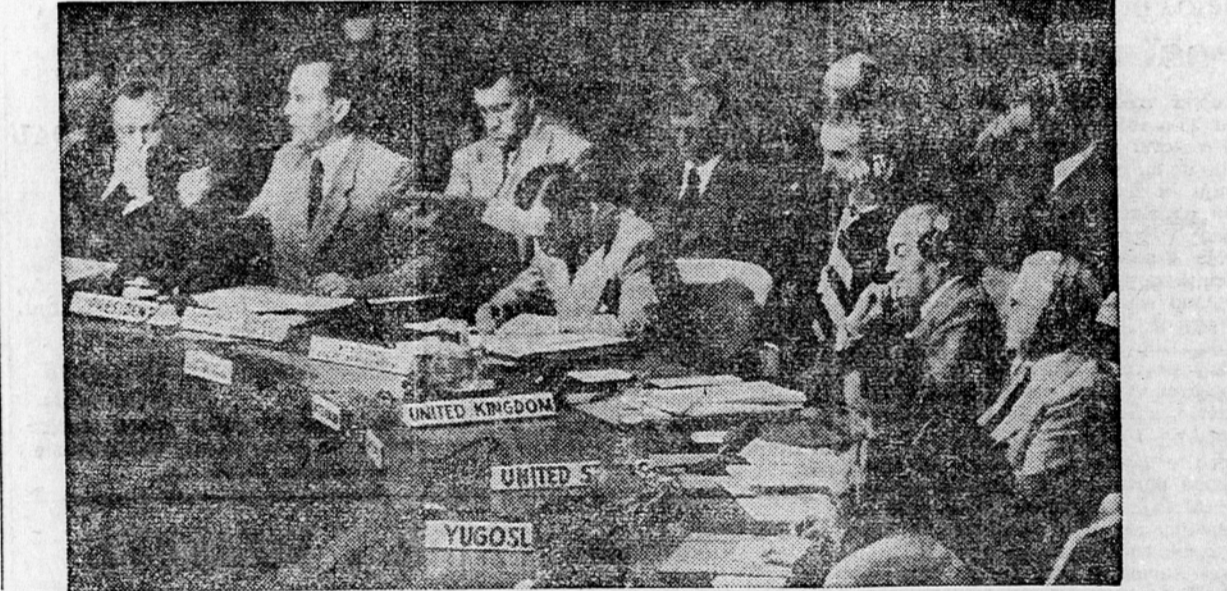
Včeraj je imel Varnostni svet svojo zadnjo sejo pod predsedstvom sovjetskega delegata Jakoba Malika, ki je ves mesec onemogočal vsako delo. Od leve proti desni: Generalni sekretar OZN Trygve Lie; Jakob Malik; angleški delegat sir Gladwyn Jebb; ameriški delegat Warren Austin; dr. Aleš Bebler.