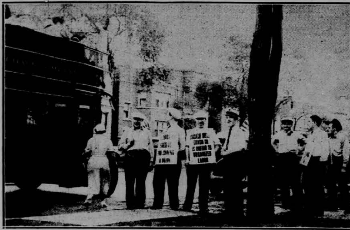
piketirajo po ulicah ter s plakati opozarjajo prebivalce, najse ne vozijo s busi, katerim šoferji zahtevajo krajši delovni čas in boljše plače.

nek čuden občutek — kakor da ga danes ne vodi prvič. Njegov obraz se ji zdi nekam poznan.