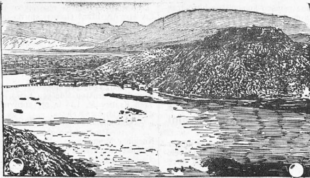
Skader s trdnjavo.