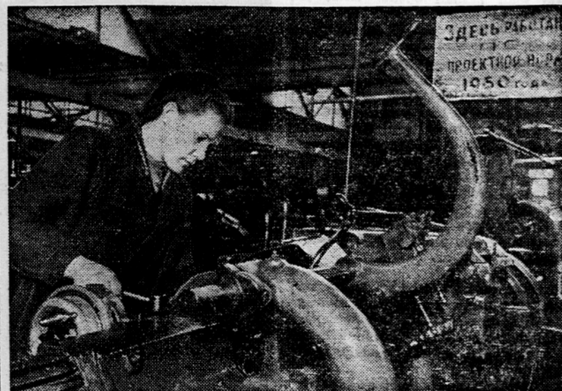
V mnogih sovjetskih podjetjih izpolnjujejo plan že za leto 1950, tako tudi v moskovski tovarni malih avtomobilov.

Duhovni svet sovjetske žene je bog in mnogostranski. Veliko, resno delo jim ne zastira pogledov na druge strani življenja. Sovjetske žene se bavijo tudi z umetnostjo, športom in turizmom, študirajo špalske znanosti