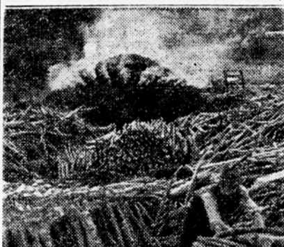
Kopa je prižgana...

V manjšo kopo naložijo okrog 80 kubikov drv in dobiš do 10.000 kg oglja, gori pa 3 do 4 tedne. Velike kope gorijo tudi do 3 mesece in dajo po več ton oglja. Nazadnje je še pripomnil: »Ko so nam povedali, kako visok je letošnji plan, se nisem ustrašil. Nakuhal bom 100.000 kg oglja!« Niže doli je drugo kopišče, ki mu streže tov. Franc Merčnik. »Zgem že 40 let in nič na svetu me ne bi moglo več odvrniti od tega dela. Kdor je pravi oglar, bo pri svojem delu ostal. Zgal sem vso letošnjo zimo in januarja sem zažgal že dve kopi. Tako sem napravil od novembra do sedaj okrog 35 ali 40 ton oglja, od tega v januarju 19.000 kg, kar je že za letošnji plan.«