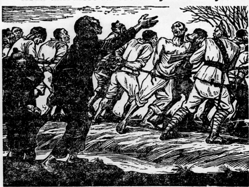
Ci Tan: Svaiba