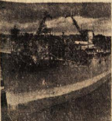
Četrta poljska 10-tonska tovorna ladjal

in baltičkem koridorju, se je rodil v gdanskem zalivu, na trati in pesku neobjen poljski otrok — Gdinja. Mestece s pristaniščem in ladjedelnico, oporišče poljske mornarice na Baltiku. Gdansk je bil takrat Danzig, zlagano mesto svobode, z močno peto kolono, ki je utrjevala mostišče nemške ekspanzije proti vzhodu. Časi, ko so zblazneli fanatiki hajljali po mestu, pretepali poljske otroke, streljali žene, v mističnem zanosu prizigali ognje za »Sonnenwende« in razobešali napise: Nur für Deutsche! — so mimo.