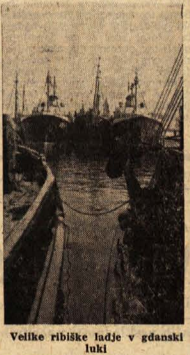
Velike ribiške ladje v gdanski luki

Danzig je spet Gdansk, poljsko mesto, svobodno in na stečaj odprt okno poljske hiše na Baltik — in v svet... Med Gdinjo in Gdanskom ni več razlike, pristanišča, ladjedelnice in mornarica so združeni pod skupno poljsko narodno zastavo. Spomin preteklosti so še redke ruševine. Gdansk je bil močno razdejan, pristanišče je ostalo celo. V Gdinji je bilo prav nasprotno, mesto je ostalo celo, pristanišče je bilo uničeno. Zdaj je večidel vse popravljeno in obnovljeno. Poljska v poslednjem času močneje pritiska proti morju; tam so pristanišča: Gdansk, Gdinja, Stećin. Novi program govori o svobodni menjavi blaga z vsemi deželami, ki to hočejo in ne postavljajo posebnih pogojev. Trgovati je najlaže po morju. Baltik pomeni za deželo odprto cesto, ki se končuje