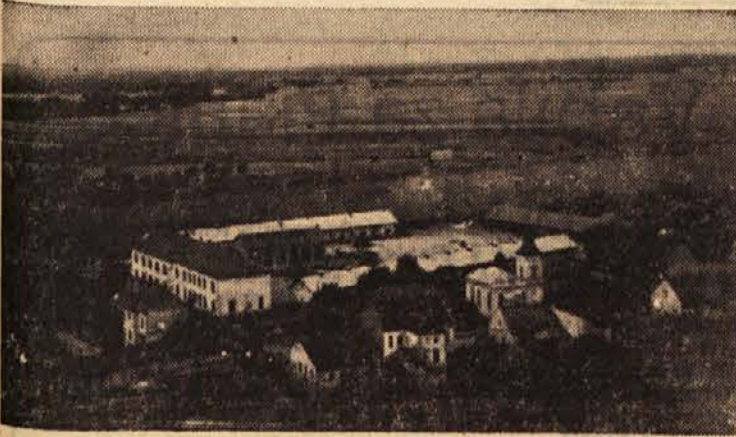
Za Lendavo se razprostira prekmurska ravan