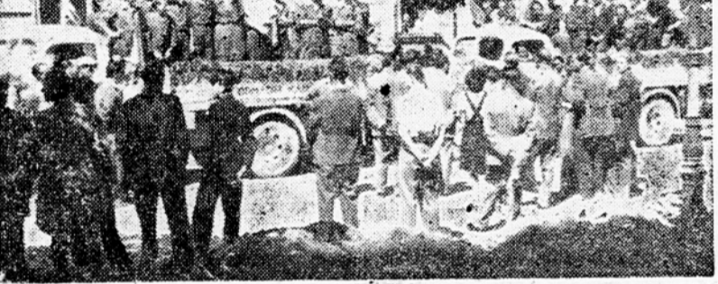
Tovorni avtomobili pred vladno palačo v Ljubljani