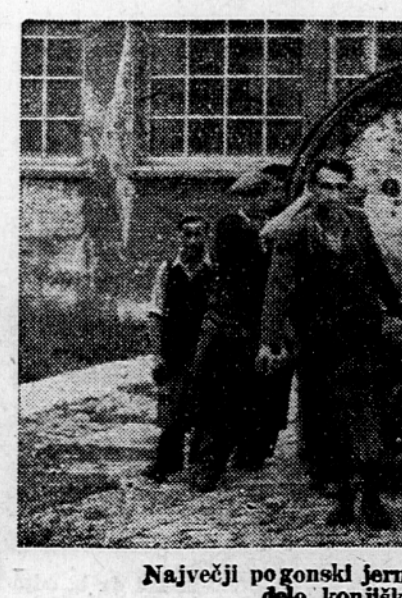
Največji pogonski jermen izdelan v Jugoslaviji delo konjiških usnjarijev

Ta značilna želja je tako skromna, da smo prepričani, da jo bo mogel glavni odbor Enotnih sindikatov Slovenije marljivo konjiškim usnjarijem v kratkem izpolniti. Tako bo še bolj podčrtana velika razlika med večeraj in danes, ki jo poudarja delavstvo s svojim današnjim poštvovalnim in uspešnim delom.