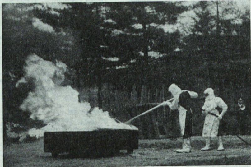
24. aprila so imeli litostrojski gasilci svojo slovesnost. Ob prevzemu novega gasilskega avtomobila TAM 5500 so imeli gasilsko vajo, pri kateri so bili navzoči poleg članov kolektiva tudi občinski in mestni predstavniki gasilskih društev

Na proslavi, ki bo počastila 35. obletnico vstaje slovenskega naroda in 100-letnico rojstva pisatelja Ivana Cankarja, bo sodelovalo 11 pevskih zborov iz celotne šišenske občine. Naš kolektiv je dobil na voljo 100 vstopnic po enotni ceni 10 dinarjev. Komisija za kulturo je mnenja, da je cena za vsakogar sprejemljiva in da bo na proslavi vsaj teh 100 Litostrojanov.