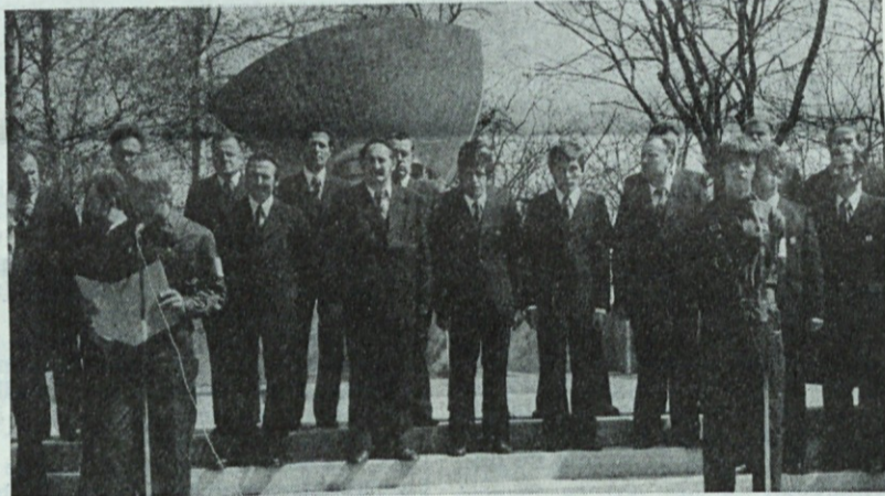
Učenca ICL — recitatorja in pevski zbor Litostroj so popestrili proslavo ob delavskem prazniku

6. Čimprej je treba priti do zaključkov v zvezi z nomenklaturjo in klasifikacijo poklicev, in sicer v celotnem jugoslovanskem prostoru. Veliko je že zamujenega, saj zahteva izdelava profilov poklicev in še zlasti učnih programov precej časa. Temeljito je treba pregledati obstoječe poklicne profile in učne načrte. Zaradi številnih tehnoloških novosti se jih namreč ne bo dalo kar takoj uporabiti za bodoče usmerjeno izobraževanje. V zadnjih letih so se na primer v elektro poklicih pojavile številne novosti zaradi uvajanja elektronike in je vprašanje, če sedanji učni načrti in poklicni profili za to stroko še ustrezajo. Podobno je pri drugih strokah.