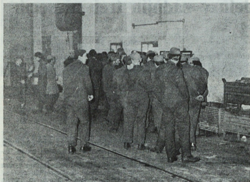
V pričakovanju malice

Pri opravljanju novih družbenopolitičnih zadolžitvev mu želimo veliko uspeha.