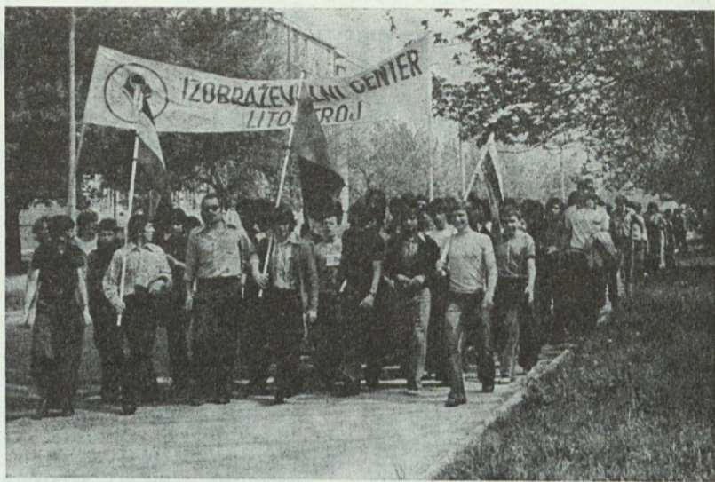
Vsi učenci IC Litostroj so se udeležili 20. pohoda po poteh partizanske Ljubljane