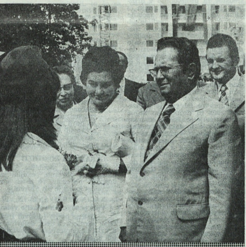
Še mnogo zdravih let drzagi tovariš Tito

na energetiko. V tovarni moramo priceti z ločevanjem individualne in tako imenovane maloserijske proizvodnje. Obe zahte-