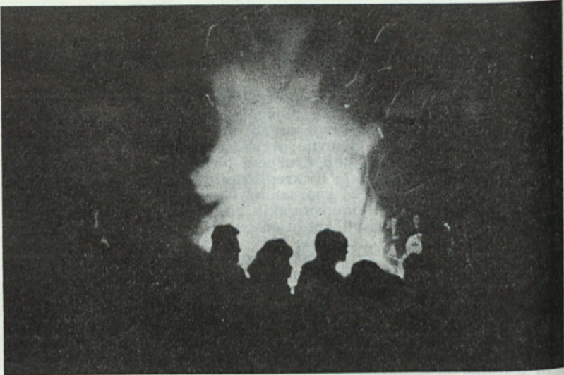
Predvečer 1. maja ob tabornem ognju

busna izleta v Pulo, Medulin, Poreč in bližnjo okolico.