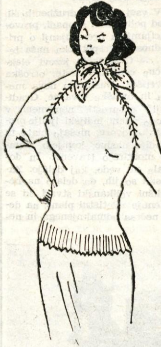
Skica zgoraj: Zadnje čase zelo priljubljen model pulloverja, oprijete v bokih, ki si ga lahko same spletemo iz črne, ne preveč debele volne. Rutka za vratom ga lepo poživijo. V naslednji številki bomo objavili kroj in podrobna navodila za pletenje.