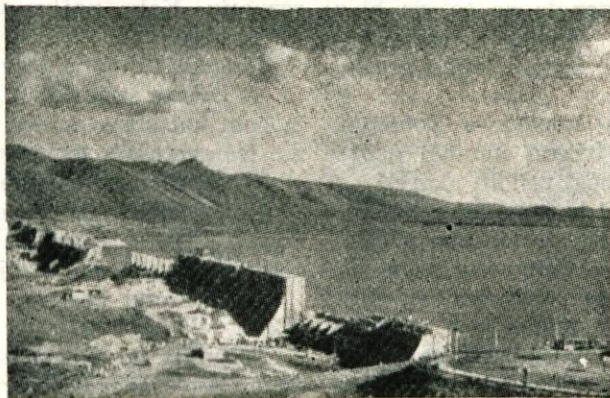
Jez Tangabadra med gradnjo