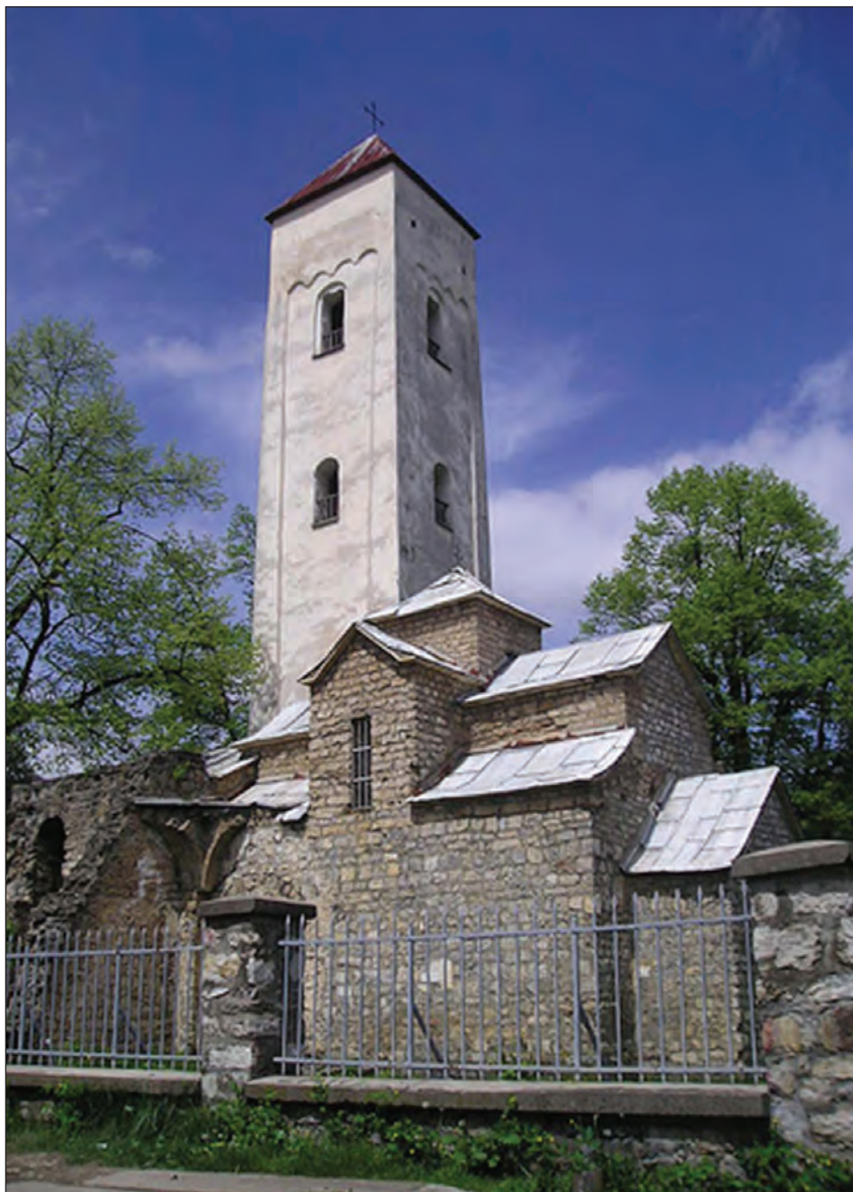
Sl. 2: Crkva Svetog Petra u župi Lim (Bijelo Polje, Crna Gora).