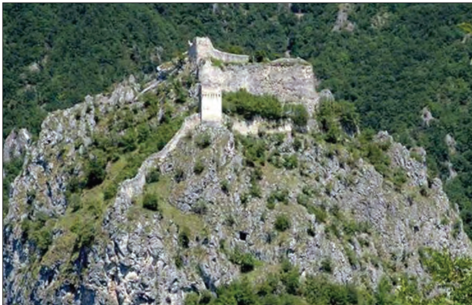
Sl. 1: Grad Mileševac u župi Crna Stena (Prijepolje, Srbija).

U današnjem administrativnom pogledu Srednje i Donje Polimlje čine općine: Bijelo Polje (pripada državi Crnoj Gori), Prijepolje, Priboj (pripadaju Srbiji) i Rudo (pripada Bosni i Hercegovini) (Dragović, 2004, 6–36).