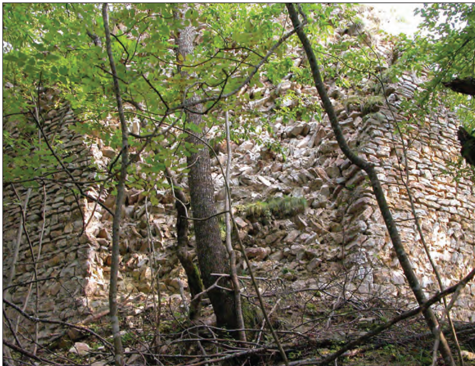
Sl. 3: Ostaci utvraenog grada Severin u župi Dabar (Priboj, Srbija).

U nekim ugovorima o prijenosu robe za Polimlje predviđa se opasnost od Osmanlija. Naime, prema ugovoru od 4. kolovoza 1388. godine, Bogoje Marojević se obavezao da preveze 20 tovara tkanina do Prijepolja, ali ako ne bude mogućnosti izvršiti zadatak zbog opasnosti od Osmanlija ili njihovog dolaska, da ih vozi tamo gdje Bogoje odredi (Dinić–Knežević, 1982, 65). Od 1391. godine do 1405. godine nema arhivskih podataka o karavanskom prijenosu robe iz Dubrovnika prema Prijepolju. Ova pojava sigurno je u vezi s novonastalim političkim događajima u Bosni poslije smrti kralja Tvrtka I 1391. godine (Petrović, 1980, 160–168).