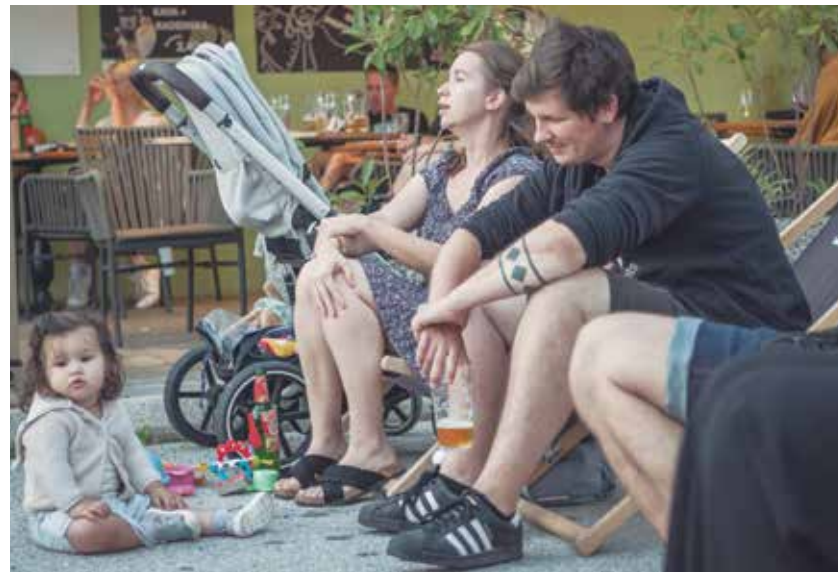
Koncerti privabijo občinstvo vseh starosti.