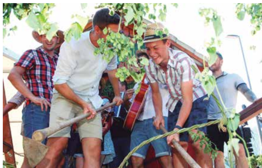
Mladi so na vozovih pripravili zanimive predstavitve starih hmeljarskih opravil, ki so jih pospremili z obilico smeha in dobre volje.