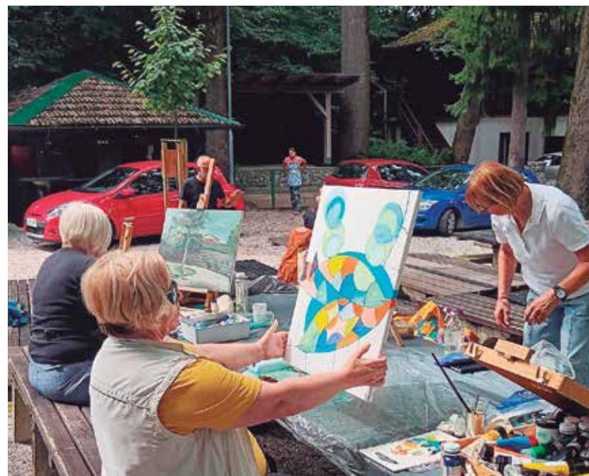
Med ustvarjanjem v letnem gledališču Limberk