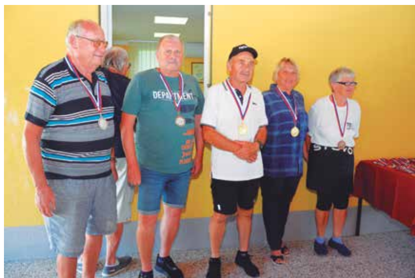
S podelitve medalj najboljšim dvojicam v balinanju

Krajši kulturni program ob plesu so pripravile pionirke PGD Gomilsko. Uradni prevzem gasilskega avtomobila GVC-1, ki je velika in koristna pridobitev za kraj in tudi širše, bo 28. septembra.