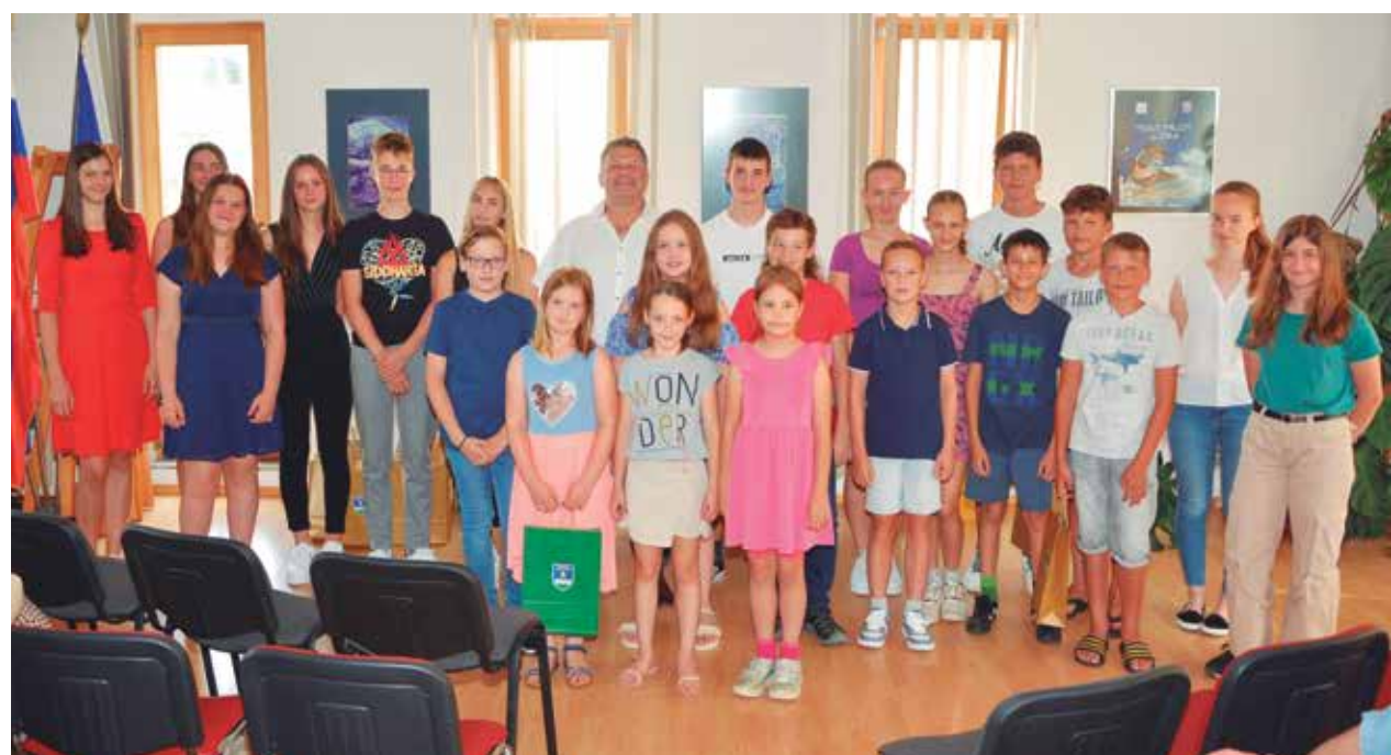
Skupna slika vseh prisotnih dobitnikov priznanj z županom

sta vsem dobitnikom priznanj čestitala in jim zaželela veliko uspehov pri nadaljnjem izobraževanju. Po podelitvi priznanj se je v veliko zlato knjigo najboljših učencev vpisalo šest odličnjakov, ki so vseh devet let imeli odličen uspeh. Na različnih tekmovanjih so bili uspešni še trije. Ob koncu uradnega dela je sledilo prijetno druženje ob sladkih dobrotah, ki so jih pripravile članice Društva žena in deklet Občine Tabor.