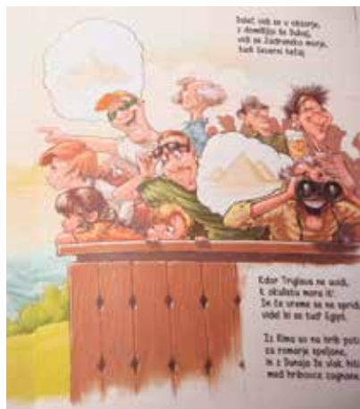
Izsek iz knjige, ki predstavlja Hom in razgled z njega.