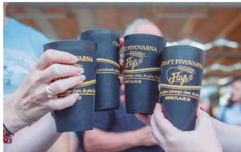
Na festivalu KRIGLFEST ste lahko uporabili vračljivi kozarec - EKOZARČEK. Craft pivo ste lahko pili iz trajnostnega kozarca.