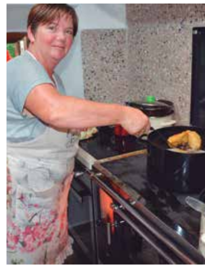
Na štedilniku v lani prenovljeni kuhinji se je »pohalo« na veliko.

sko avtohtono pasmo rdeče do kostanjeve rjave barve z belimi lisami, ki je vajeno muljenja trave na alpskih pašnikih, in tri bosanske plemenske konje, ki so v svetovnem merilu ogrožena pasma.