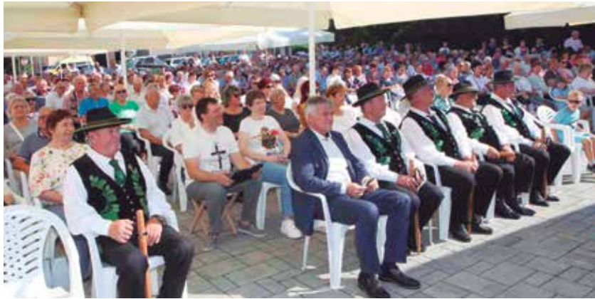
V Petrovčah se je slovesnosti in maši ob prazniku ponovno udeležila velika množica vernikov.

Na cerkveni in državni praznik Marijinega vnebovzetja, ki ga praznujemo 15. avgusta in je od leta 1992 tudi v Sloveniji dela prost dan, so bile romarske cerkve tudi letos polne vernikov.