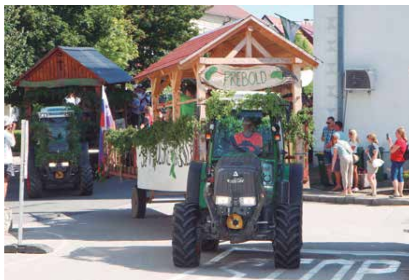
Na dnevu hmeljarjev ne gre brez tradicionalne povorke.