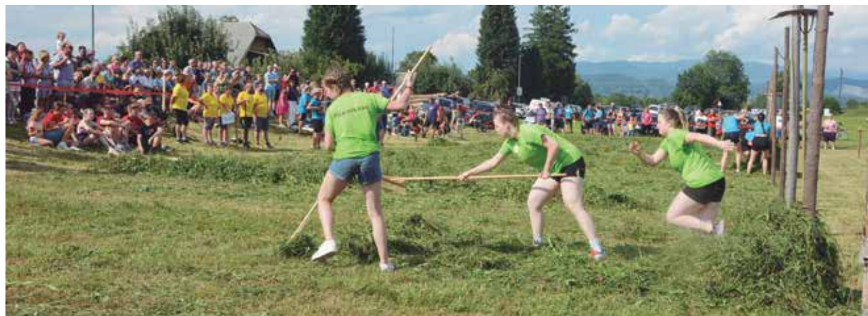
Po košnji je sledilo tekmovalje v grabljenju.