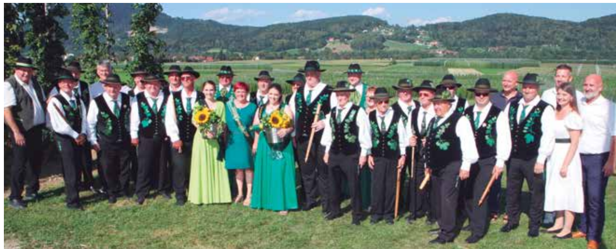
Hmeljarski starešine s prejšnjim in novim parom ter župani, med princesama je mama nove princese, prav tako pred leti imenovana za hmeljsko princeso.

pred zahtevnim obdobjem obiranja hmelja. Tudi letos so se hmeljarke in hmeljarji, strokovnjaki s področja hmeljarstva in gostje najprej zbrali v dvorani Doma kulture Braslovče na slavnostni seji Združenja hmeljarjev Slovenije, ki letos praznuje 20-letnico delovanja. Na seji je svoje približno