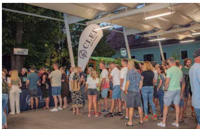
Vrste za pivo so bile za žejne predolge.

Na Zavodu za kulturo, šport in turizem Žalec skupaj z nekaterimi drugimi organizatorji do konca sezone v oktobru pripravljajo še nekaj prireditev. Že to soboto, 31. avgusta, se lahko odpravite na tradicionalni Pohod po hmeljski poti, sledita pa še Savinjski Oktoberfest 5. oktobra in Hmeljarski likof 31. oktobra, ki bo tudi zaključna prireditev sezone.