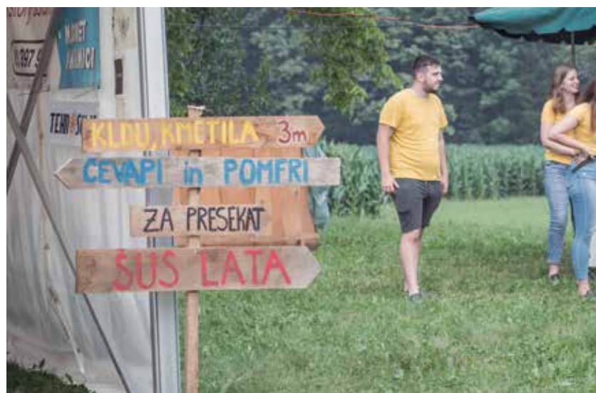
Domiselni člani taborske podeželske mladine so poskrbeli tudi za "ustrezne" usmerjevalne table.