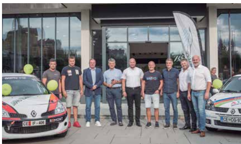
Župani in glavni akterji po sredini novinarski konferenci