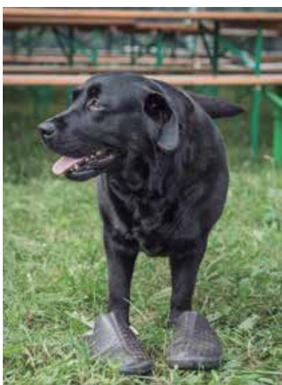
Tudi pasja obiskovalka Donna je preizkusila udobnost jazbečark, ampak le za fotografijo.