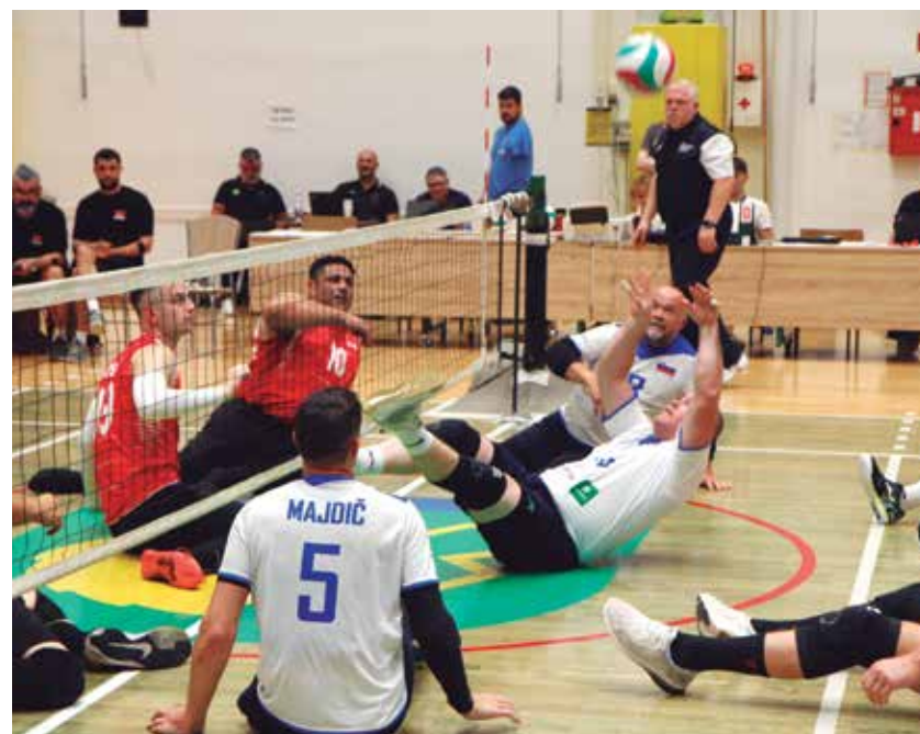
S tekme Slovenija : Turčija, ki so jo Turki gladko dobili s 3 : 0; slovenski reprezentanti v belih dresih.