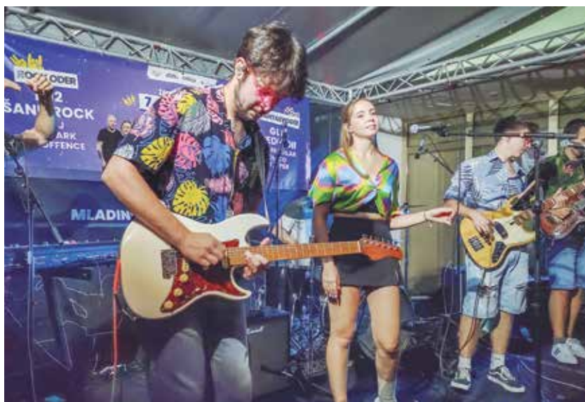
Nastop skupine Slow Monkeys