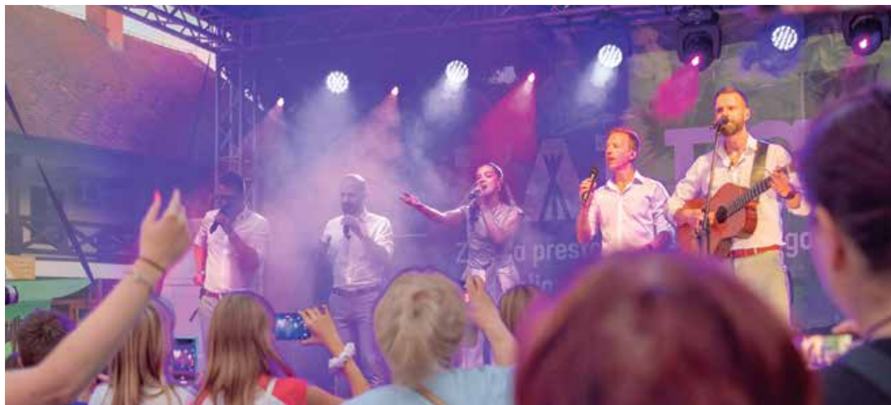
Množica obiskovalcev na žalski tržnici ob fontani piv je po prijetnem koncertu Kvartopirciev in kratkem gostovanju Nine Pušlar na brezskrbni poletni večer pričakovala rajanje do zgodnjih jutranjih ur.