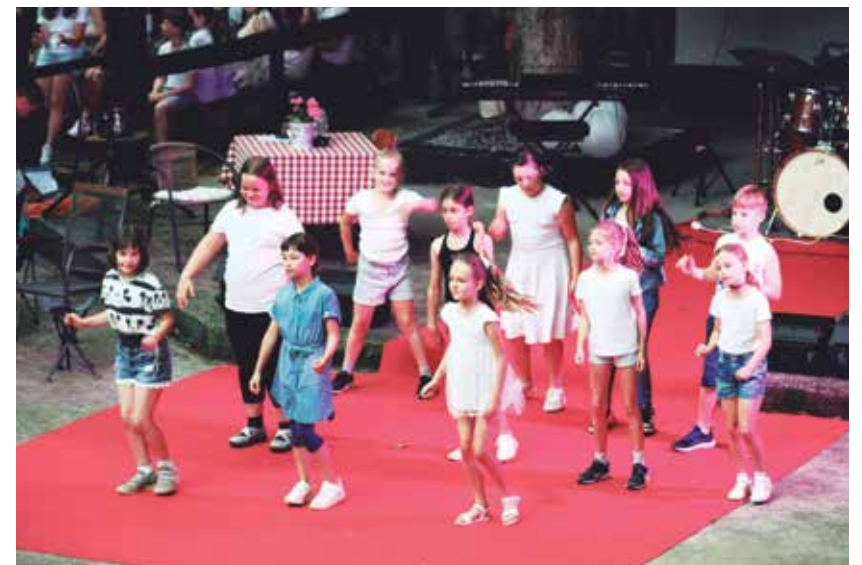
Prireditev so s plesom, petjem in glasbo bogatili tudi učenci OŠ.