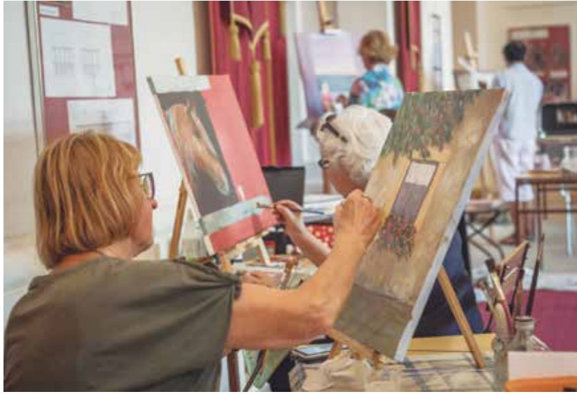
Nekateri se med ustvarjanjem raje skrivajo v notranje prostore.

Letošnje kolonije v Dvorcu Novo Celje se je udeležilo več kot 40 ljubiteljskih slikarjev z vseh vetrov – iz Savinjske, Prekmurja, Novega mesta, Ljubljane in Ukrajine.