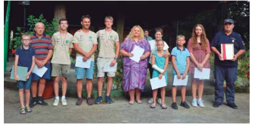
Dobitniki priznanj, ki so bili prisotni na slavnostni seji.