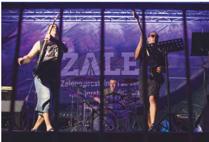
Domačini Gasos Band, izvajalci z glasbene kompilacije Savinjska ima novo muziko 2023 Društva Dobra ideja s Polzele

Dodala je še, da obiskovalce sicer najbolj pritegnejo zvoneča imena zasedb, a imajo priljubljene slovenske skupine tudi svojo ceno, to pa so vendarle brezplačni koncerti: »Zato smo pri izbiri glasbenih skupin omejeni tudi s finančne plati. Poletni koncerti so tako za nas predvsem možnost, da na oder povabimo manj znane, a zelo kakovostne zasedbe (npr. Soul, jazz in jaz, sestavljena iz samih vrhunskih glasbenikov), ki jih sicer med letom nimamo priložnosti slišati. Trudimo se, da vsako leto damo priložnost tudi lokalnim glasbenim zasedbam, letos sta to bili Gasos Band in 3TONE, ki sta se več kot uspešno predstavili domačemu občinstvu, a ju je žal proti koncu koncerta pregnal dež.«