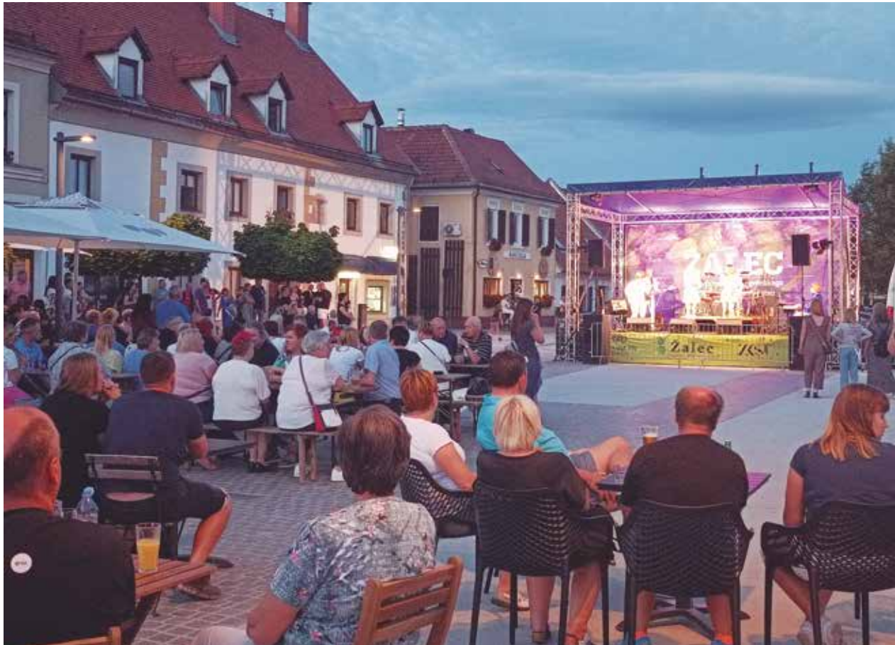
Odlični obisk na preigravanju Abbinih uspešnic

Nastopilo je pet glasbenih zasedb, ki so zabavale v ritmihih popa, rocka, funka, jazza, soula in bluesa ter prepevale zimzelene slovenske in tuje popevke.