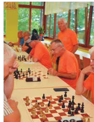
Tokrat so največ točk za dosežen rezultat prispevali šahisti, ki so bili podprvaki iger.

v košarki, deveto v vlečenju vrvi, trinajsto v metu bombe, sreče pa tokrat niso imeli pri metanju pikada, kar jim je odščitnilo kar nekaj točk za še boljšo skupno uvrstitev.