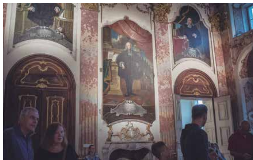
Na razstavi v Dvorcu Novo Celje je v svoje izvorno okolje vrnjenih tudi nekaj izvornikov, med njimi so trije veliki portreti grofov Gaisruck.