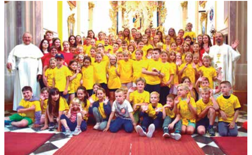
V Petrovčah 67 otrok in 17 animatorjev

Oratorij je mladinski prostovoljski počitniški program za otroke, ki deluje po pedagoških načelih Don Boskovega preventivnega sistema. Glavni protagonisti programa so mladi prostovoljci – animatorji, katerih stalna navzočnost med otroki ni nadzorniška in preprečevalna, ampak prijateljska in spodbujevalna ter usmerjena v celostno rast posameznika. V devetih župni-