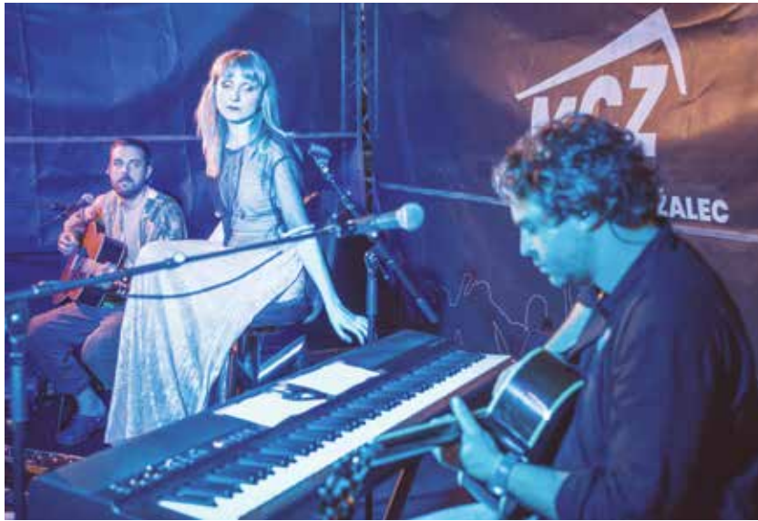
Akustični nastop skupine Fed Horses