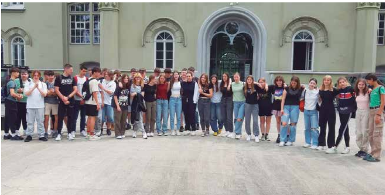
V mariborsko Kadetnico in tamkajšnji muzej so doslej veterani popeljali že veliko devetošolcev iz naše doline, nazadnje iz OŠ Braslovče (na sliki).

Zveza veteranov vojne za Slovenijo Spodnje Savinjske doline in policijsko veteransko društvo Sever Celje, odbor Žalec, ob pomoči spodnesavinjskih občin, ki omogočajo prevoz, že več let izvajajo projekt spoznavanja zgodovine osamosvojitvene vojne z ogledom muzeja v mariborski Kadetnici.