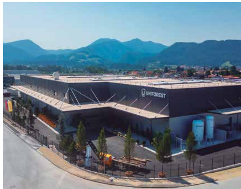
V novi hali je Uniforest uredil napredno proizvodnjo.

Uniforest je z novo halo na 4500 m 2 pridobil nove proizvodne kapacitete in skladiščne prostore z avtomatiziranim sistemom skladiščenja.