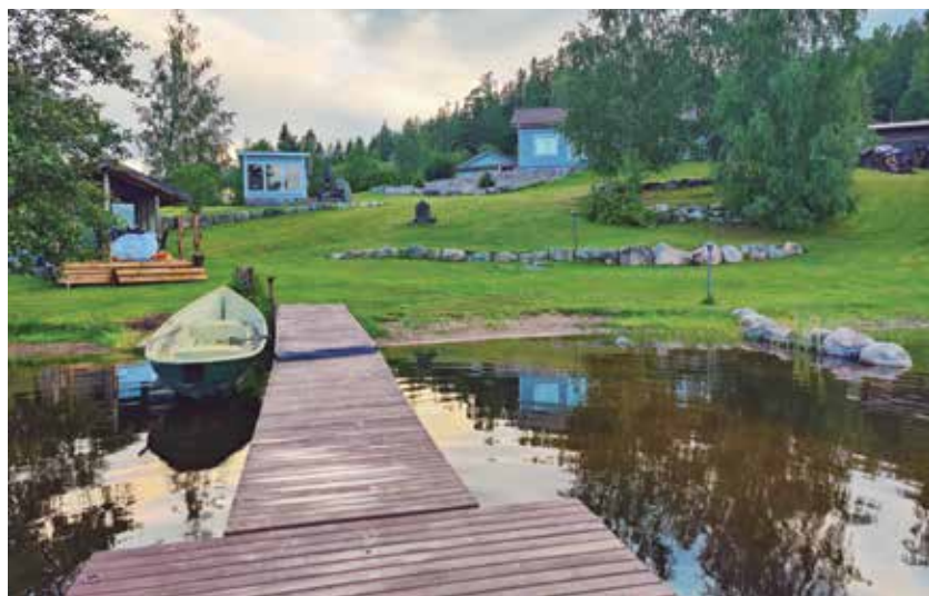
Na Finskem so imeli zasebno jezero.

»V 10 letih in po več kot 20 izmenjavah še res nismo imeli kakšne slabe izkušnje. Ljudje, ki se poslužu-