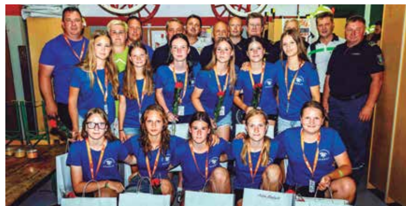
Udeleženke olimpijade z gosti