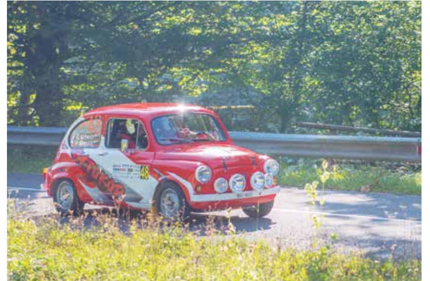
Stari dobri Fičo v akciji v Mariji Reki

V soboto, 24. avgusta, so sledile hitrostne preizkušnje po več krajih v Savinjski dolini, ki so nosile imena osrednjih podpornikov rallyja: HP Marija Reka – Tabor – Šotori Petre,