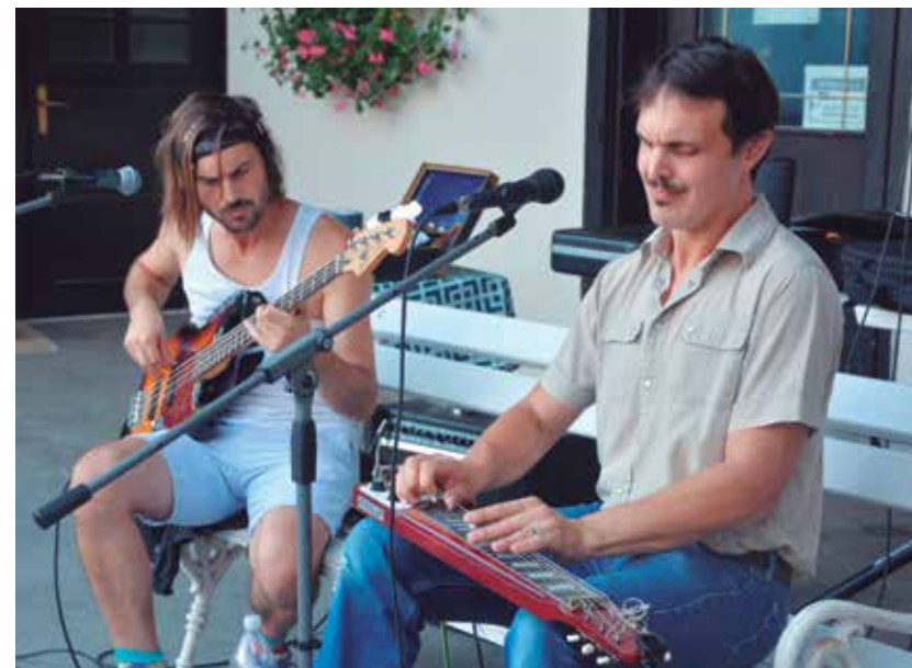
Glasbenika med igranjem na kitaro in lap steel slide kitaro