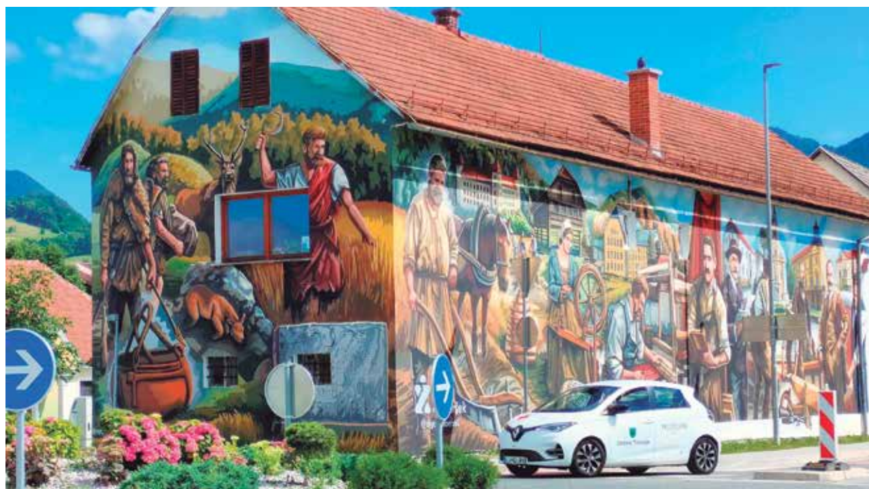
Pogled na stavbo MGC Prebold z novo fresko na severni in zahodni strani objekta.

Zagotovo pa so najbolj vidne in prepoznavne njegove stenske poslikave, ki krasijo Občino Prebold. Še posebej ponosen je na svoje zadnje velike poslikave, ki so zahtevale veliko truda in časa. Letošnja, ki je največja doslej in verjetno tudi edina tako velika v Sloveniji, je nastajala skoraj mesec dni. Vsekakor se bo, kot pravi, z veseljem spoprijel še s kakšnim takšnim ali še večjim projektom.