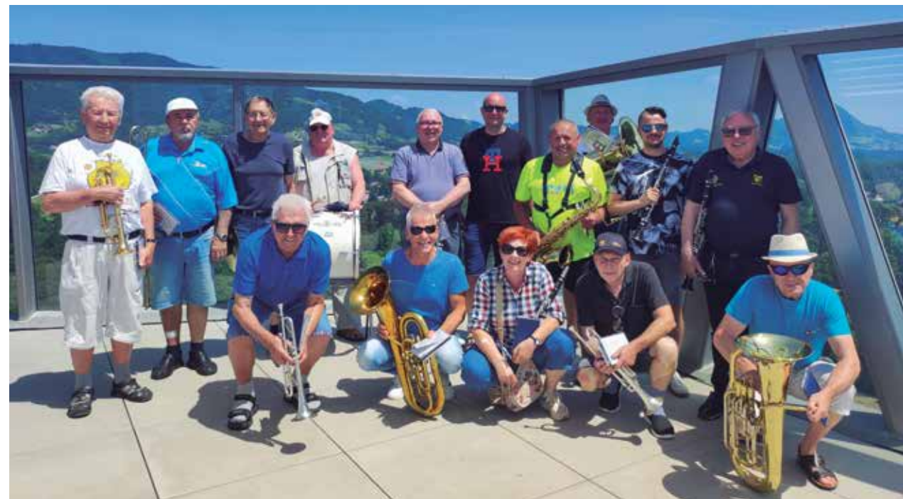
Veteranska godba je z veseljem zaigrala na vrhu stolpa in uživala ob lepem razgledu.

Veteranska pihalna godba, ki deluje v okviru Univerze za tretje življenjsko obdobje Žalec, se lahko pohvali, da je bila prva pihalna