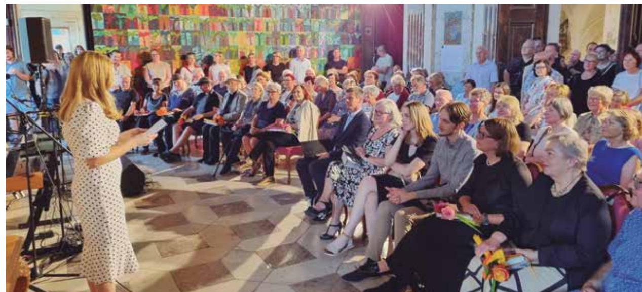
Ob odprtju razstave Procesi spominjanja in pozabe je bila velika dvorana premajhna za vse obiskovalce.

Razstava v Dvorcu Novo Celje bo na ogled do 13. oktobra, ZKŠT Žalec pa je pripravil tudi brezplačna vodenja po razstavi, in sicer 28. julija, 25. avgusta, 29. septembra in 13. oktobra, vsakič ob 18. uri.