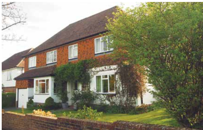
Idilični angleški dom