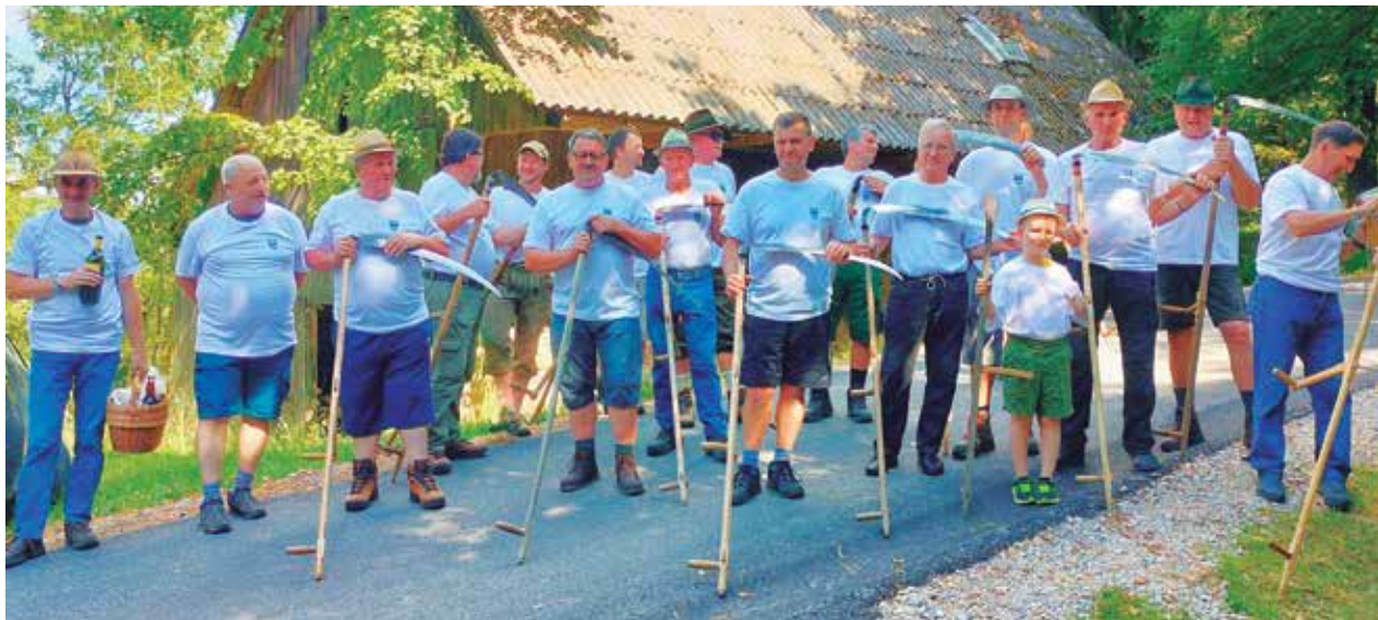
Kosci v postroju, preden so odšli do Šnepove košenice sredi gozda.

Med košnjo so bili kosci deležni osvežilnih pijač, od domačega jabolčnika do domačega soka in še česa. Ob zaključku je sledila še