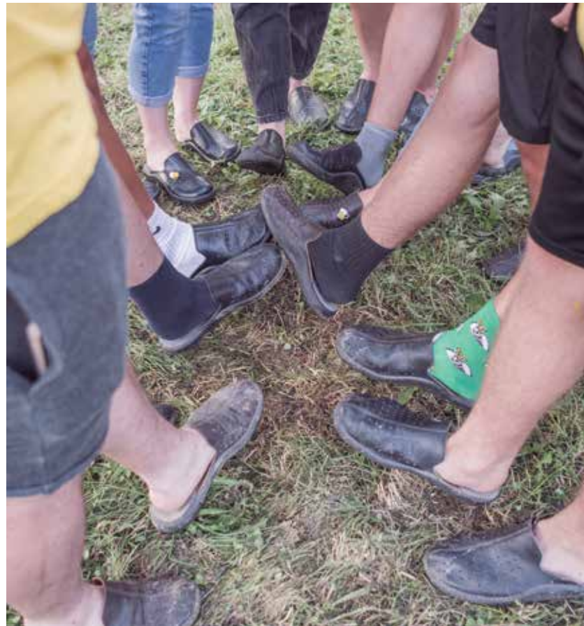
Na vsakem koraku jazbečarke