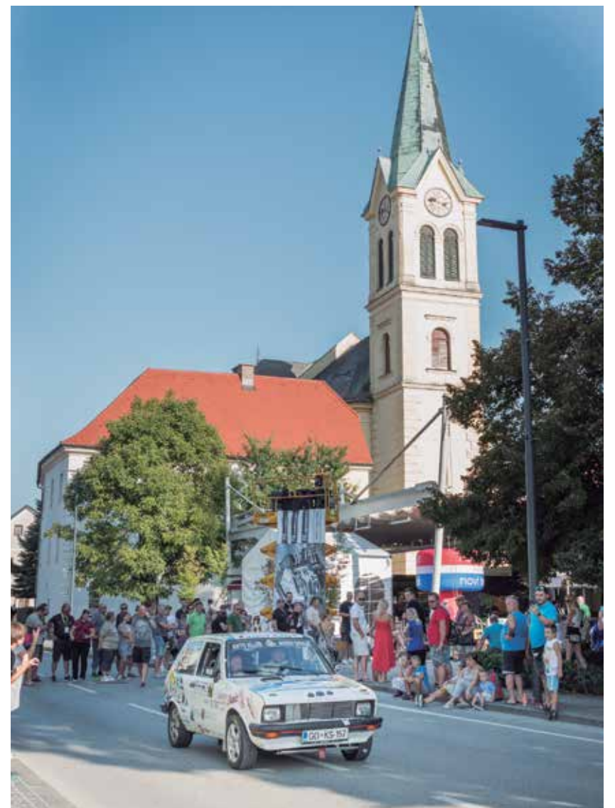
Dirkalni nostalgичni Yugo ob spremstvu pogledov žalske publike