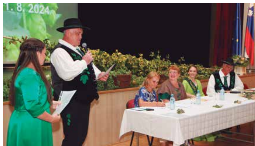
Novi hmeljarski par se je predstavil na slavnostni seji Združenja hmeljarjev Slovenije.

hmeljarskega para je bil ples, nato pa se je nadaljevalo sproščeno druženje s hmeljarskimi in drugimi zabavnimi igrami. Med drugim so se dekleta pomerila v obiranju hmelja na star način. Zabava z ansambloma Zaka' pa ne in Gadi se je zavlekla pozno v noč.