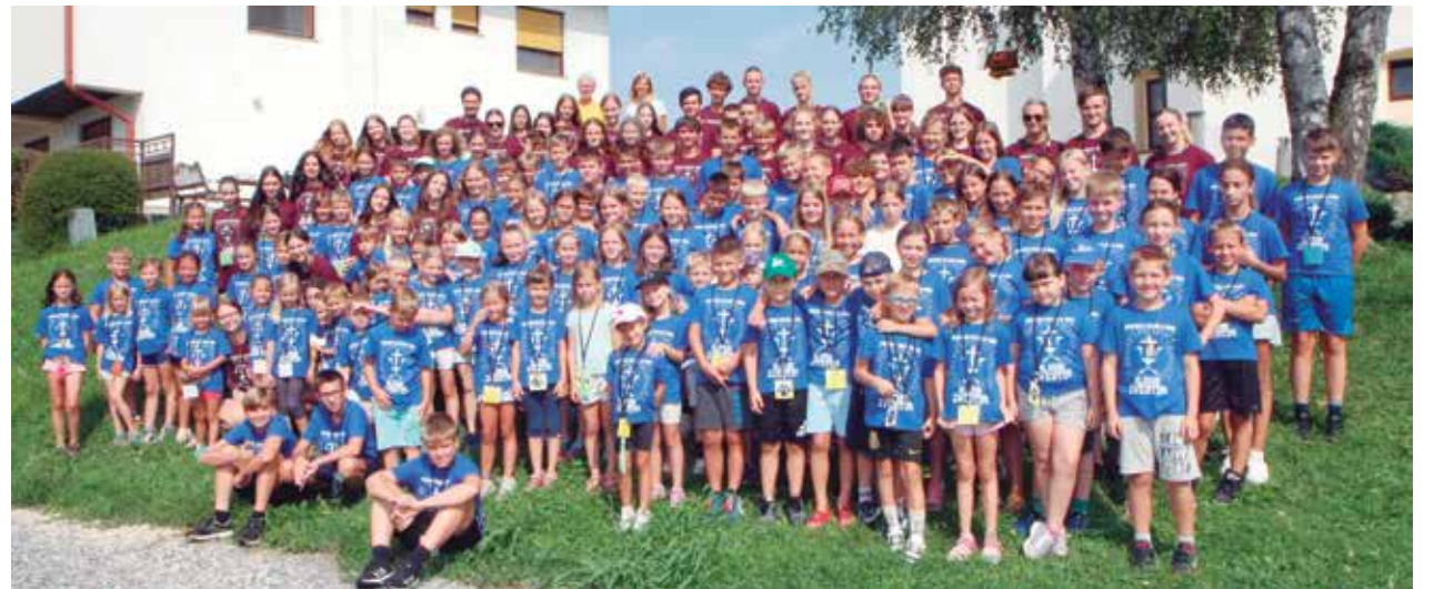
Na Polzeli je bilo kar 120 otrok in 40 animatorjev.

jah v Spodnji Savinjski dolini je na oratorijih sodelovalo 550 otrok, zanje pa je skrbelo 170 animatorjev.