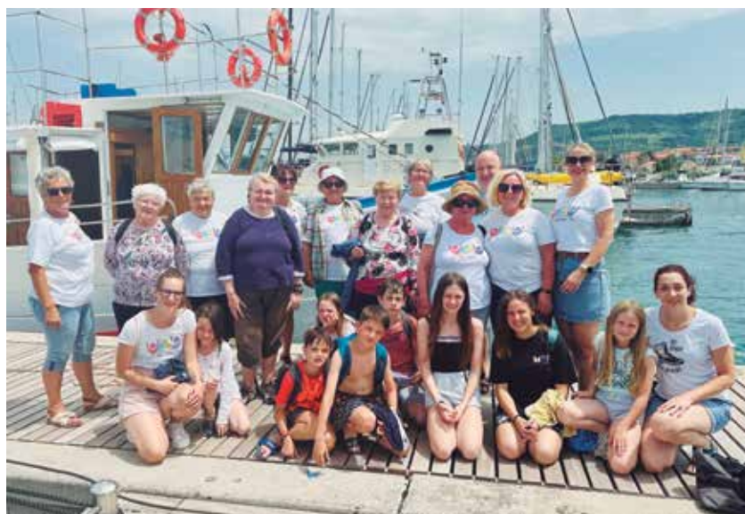
Udeležence in udeleženci tokratnega tabora na morju