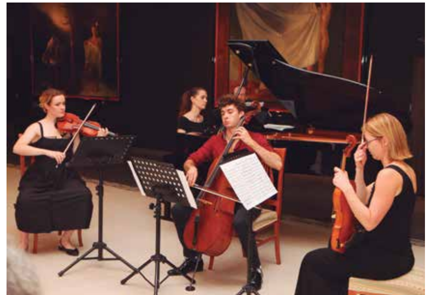
Instrumentalna zasedba Zvok okrog iz Kulturno-umetniškega društva Žalec