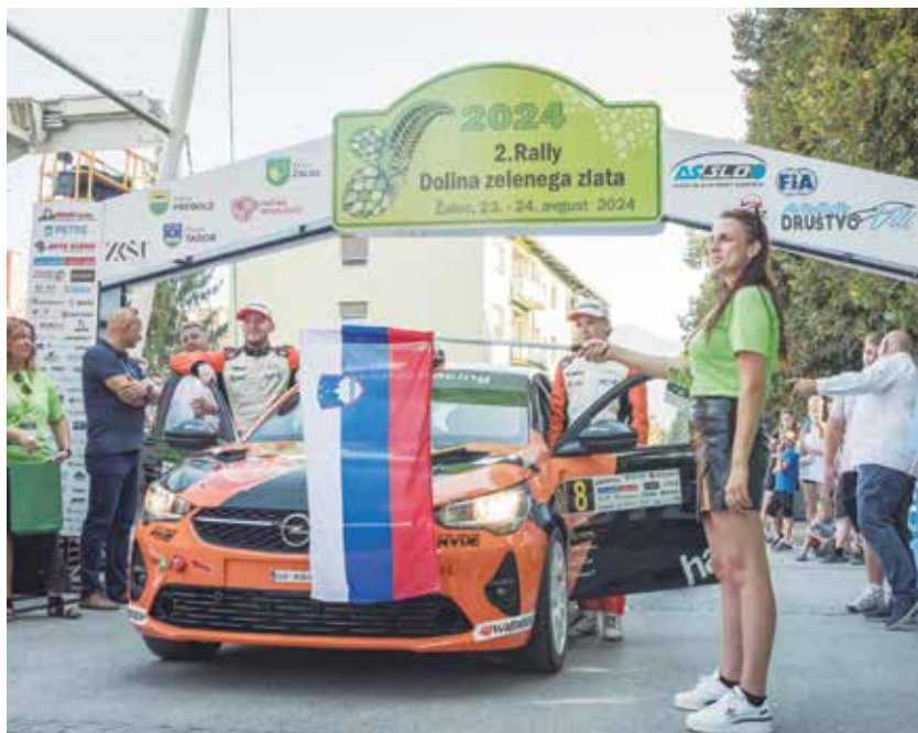
Ob petkovem štartu rallyja v Žalcu