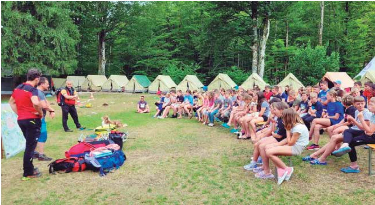
Mladi gasilci GZ Žalec z mentorji na letovanju v Bohinju

72 otrok in devet mentorjev iz GZ Žalec je letovalo v taborniškem centru v Bohinju.