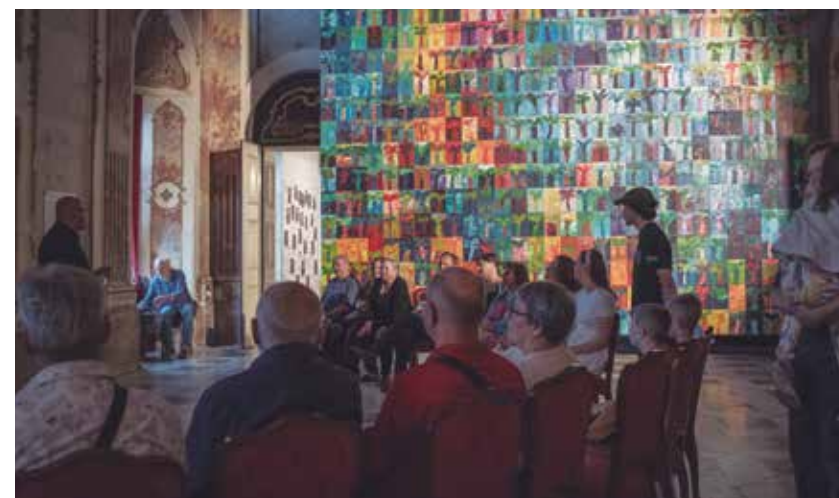
Z enega od poletnih brezplačnih vodenj po razstavi, v ozadju samopodoba Veljka Tomana, sestavljena iz 800 delov.

Razstava Procesi spominjanja in pozabe je v Dvorcu Novo Celje na ogled do 13. oktobra, ZKŠT Žalec pa je pripravil tudi brezplačna vodenja po razstavi, in sicer 28. julija, 25. avgusta, 29. septembra in 13. oktobra, vsakič ob 18. uri.