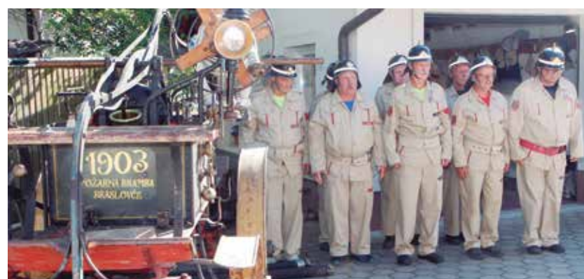
Enota PGD Braslovče z ročno brizgalno iz leta 1903

Družabni del dogodka se je odvijal pri gasilskem domu v Zabukovici, kjer so se gasilci in krajani družili še dolgo v noč.