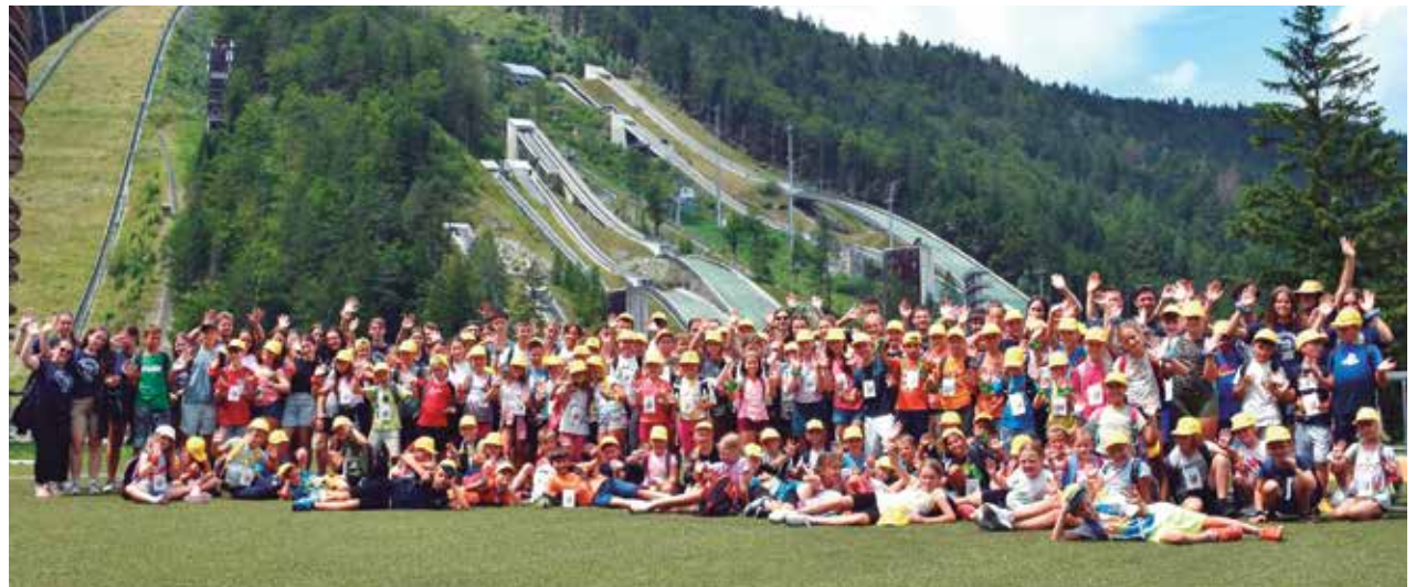
Na Gomilskem 121 otrok in 42 animatorjev skupaj v Planici