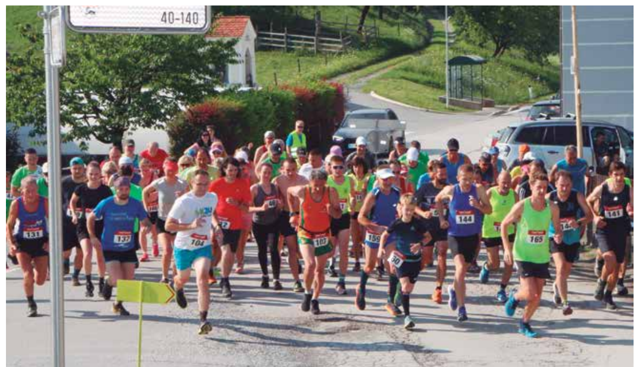
Kmalu po startu v Andražu nad Polzelo

Letošnji gorski tek na Goro Oljko za Zoranov pokal, ki ga organizirata PD Polzela in ŠD Andraž nad Polzelo, je potekal 13. julija, bil pa je že 20. po vrsti. Teklo je 76 tekačev v osmih kategorijah iz raznih krajev Slovenije in tujine, veljal pa je tudi za točke štajersko-koroškega pokala 2024.