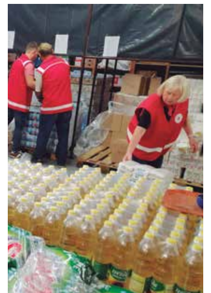
Pri pripravi hrane v skladišču v Žalcu

Naslednja delitev hrane bo oktobra, o čemer bodo upravičene obvestili preko SMS-jev in običajne pošte.