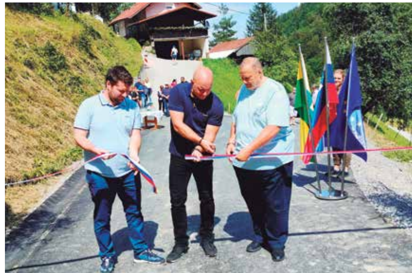
Med prerezom otvoritvenega traku