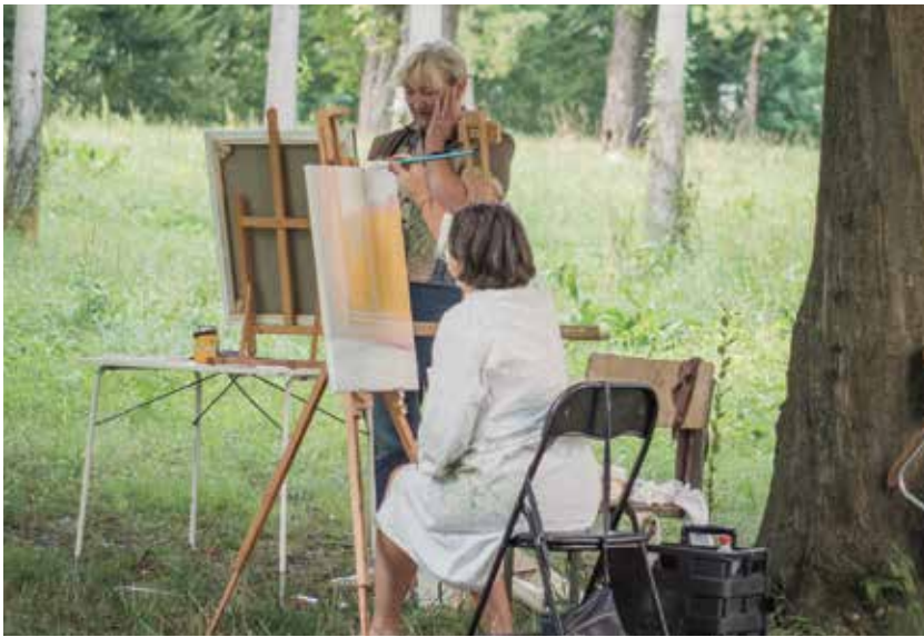
Najlepše je ustvarjati v naravi.