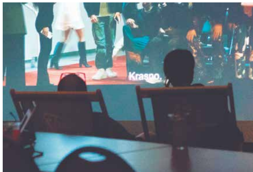
Projekcije poletnih filmov osvetljujejo pomembne teme.

BINA PLAZNIK BINA PLAZNIK, ARHIV MC ŽALEC