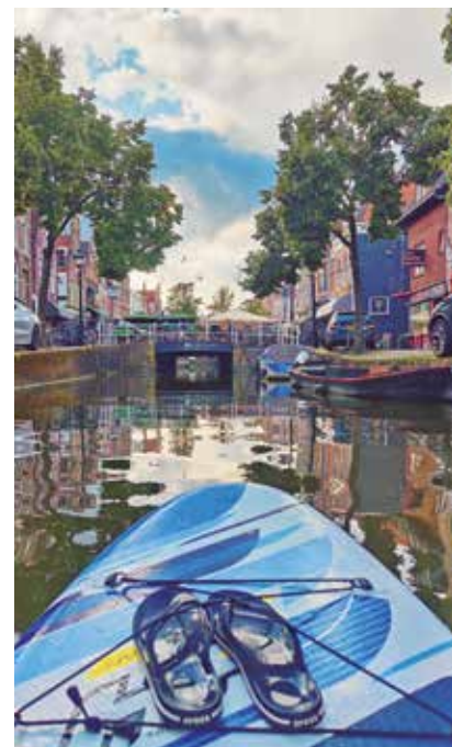
Supanje po Aalkmarju

»Na prej omenjeni spletni strani se lahko registrira vsak. Treba je pripraviti čim bolj zanimivo predstavitev svojega doma in destinacije, da potencialni gostje čim bolj vidijo, kaj lahko pričakujejo. Obstaja 21-dnevno poskusno obdobje, vendar je verjetno za kakšno izmenjavo potrebno enoletno članstvo, ki pa je, roko na srce, bolj simbolično. Vsi člani imajo na strani pri predstavitvi navedene tudi reference in se tako lahko pri njihovih prejšnjih partnerjih pozanimamo o tem, kakšne so izkušnje s članom ter kakšna je lokacija potencialne izmenjave.«