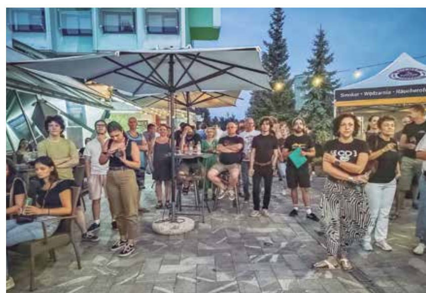
Mlade glasbenike je podprlo številno občinstvo.

ji. Ob koncu je strokovna komisija s pomočjo glasovanja publike v razmerju 50/50 določila zmagovalca, ki bo nastopal na Žalski noči mladih, ki bo 7. septembra 2024. Prav tako je žirija izbrala glasbeno skupino, ki bo prejela snemanje v profesionalnem glasbenem studiu. Skupna ocena je tokrat prinesla zmago skupini Midnight Nick.