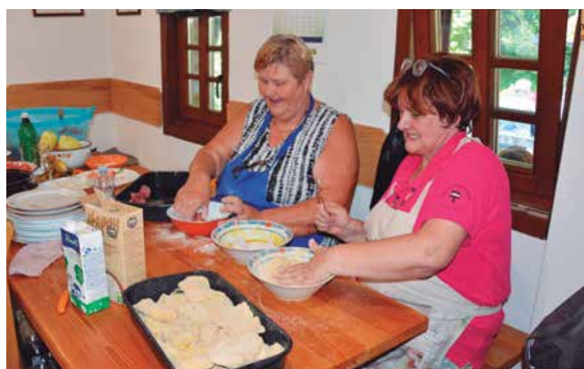
Članice Društva žena in deklet Občine Tabor med paniranjem kunčjega mesa, ki so ga v dveh dneh pojedli zelo veliko.