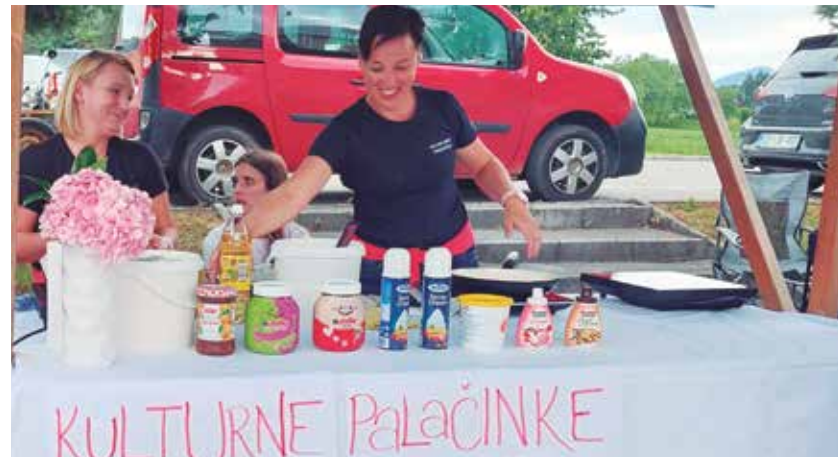
Stojnica KD, na kateri so pekli »kulturne« palačinke.

Vse potrebne informacije v zvezi z javnim razpisom lahko dobite na sedežu Občine Žalec v času uradnih ur ter na tel. št. (03) 713 64 74. Razpisno dokumentacijo in vlogo lahko prosilci prevzamejo od 2. 9. 2024 do zaključka razpisa na spletni strani Občine Žalec www.zalec.si in v glavni pisarni Občine Žalec.