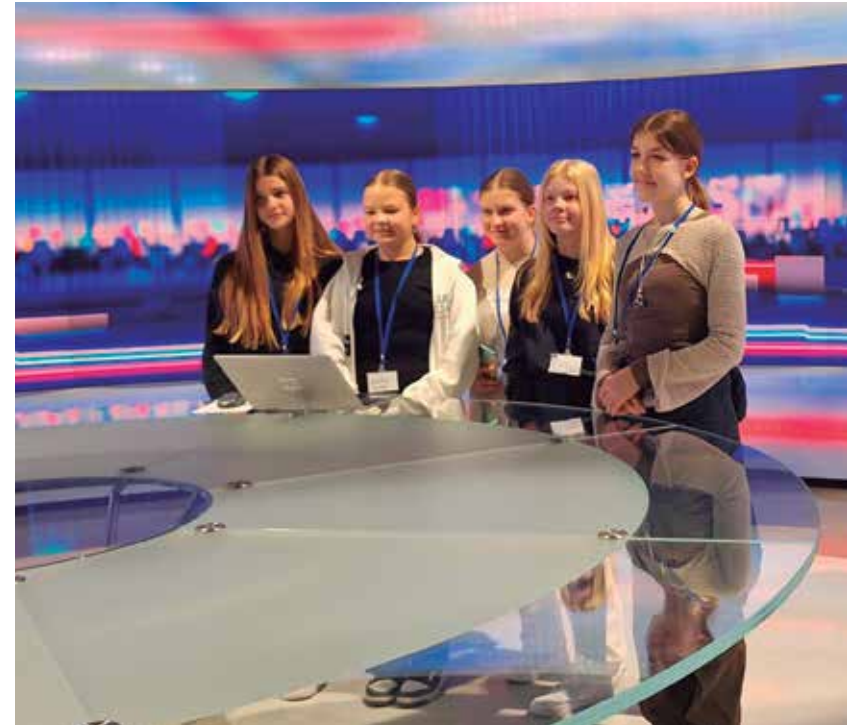
Učenke iz OŠ Griže, ki so raziskovale poklice, med obiskom na RTV Slovenija, v studiu, kjer pripravljajo osrednje informativne oddaje.