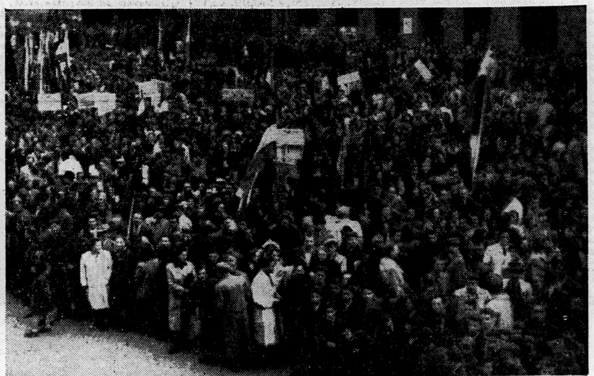
V četrtek popoldne se je na Glavnem trgu v Mariboru zbralo nad 30.000 ljudi, ki so ogorčeno demonstrirali proti mešetarnjenju v Londonu in proti italijanskemu klerofašizmu

Prav tako kot profesorji in učitelji (Nadaljevanje na 2. strani)