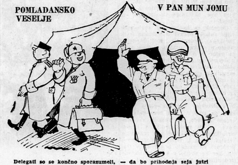
Delegati so se končno sporazumeli, — da bo prihodnja seja jutri

Pan Mun Jom, 18. apr. (AFP). Kitajski in severnokorejski predstavniki so sprejeli na današnjih pogajanjih v Pan Mun Jomu predlog Združenega poveljstva, naj bi se nadaljevali zaupni razgovori o izmenjavi ujetnikov. Ta pogajanja so prenehala 4. aprila, ker so Kitajci in Severnokorejci vztrajali na tem, naj bi obvezno repatriirali ujetnike, medtem ko je zahtevalo Združeno poveljstvo prostovoljno repatriacijo. V podkomisiji za nadzorstvo premirja, ki proučuje graditev letališč in udeležbo Sovjetske zveze v nevtralni komisiji, se pogajanja še zmerom niso pomaknila z mrtve točke.