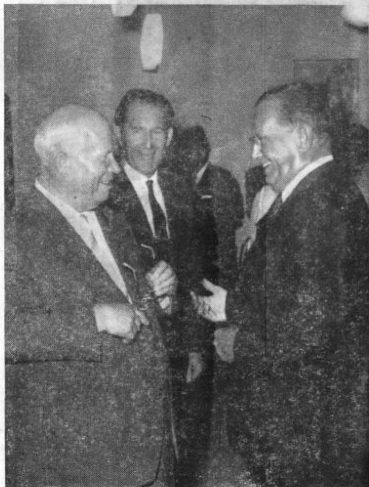
Ob lanskoletnem obisku: V pristrčnem razpoloženju je tekel razgovor o velenjskih rudarjih in njihovi proizvodnji.