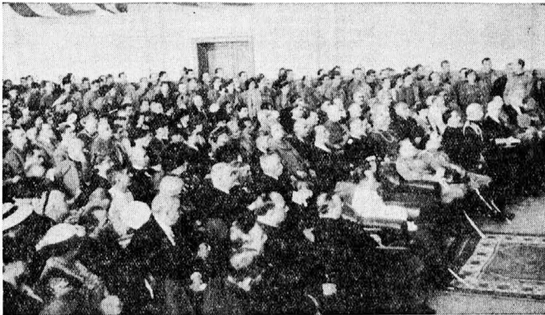
Sa svečane Akademije Saveza Sokola K. J. prilikom Kraljevog rođendana, u Beogradu