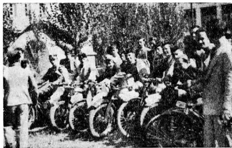
Motorizovana štafeta polazi iz Saveznog Doma