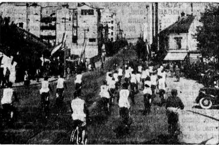
Соколска штафета трчи кроз Београд