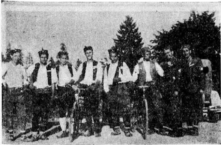
Штафета једне соколске чете у Босни