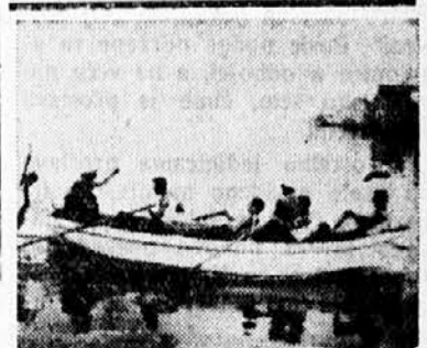
Штафета која је веслала 28 км. морем до Шибеника

После завршеног програма, о коме се може само са дивљењем говорити и за чије извођаче и организаторе, као и за сав рад Сокола III не достају речи похвале, развило се народно весеље, проткано интимном атмосфером, која је дала упечатљив биљег читавој приредби. ЈМ.