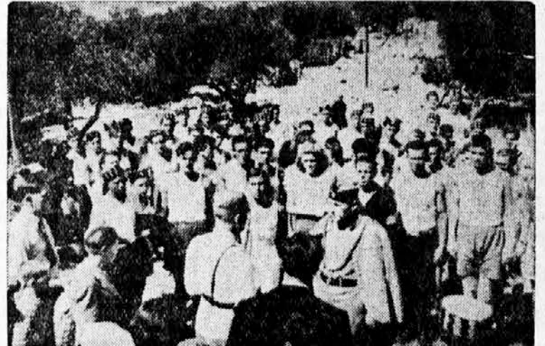
Štafete župa Split i Šibenik predaju poslanice