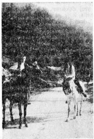
Susret sokolske štafete na planini Romaniji