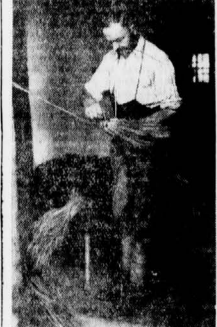
Besenbinder bei der Arbeit

An den langen Winterabenden, aber auch in den Stunden, die die Arbeit auf Feld und Acker frei lassen, werden eifrig Besen gebunden. Da sieht man die Leute — meistens Frauen — in der Stube oder vor der Haustüre sitzen und bald ist ein schöner Besen fertig. Wir nehmen ihn zur Hand und staunen über die Qualität. Diese festen, widerstandsfähigen Besenfasern, die sich im wahren Sinn des Wortes »kratzbürstig« anfühlen, also jene Eigenschaft besitzen, die ein guter Besen haben muß — das ist ja Reisstroh, das beste und begehrteste Besenmaterial! Ja, wächst denn im Unterland Reis? Wir untersuchen den Besen nochmals. Zweifelsohne, das ist Reisstroh! Lächelnd gibt uns die flinke Besenmacherin Auskunft. Nein, es ist nicht Reisstroh, es sind die Stengel des »Sirk«, der im Unterland zur Besener-