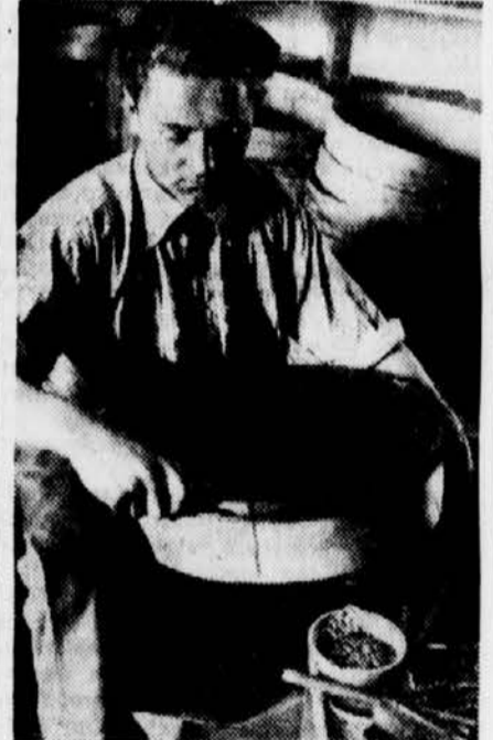
Auch Siebmacher gibt's im Unterland

Sehr verbreitet im Unterland ist auch im Hausgewerbe das Schnitzen von