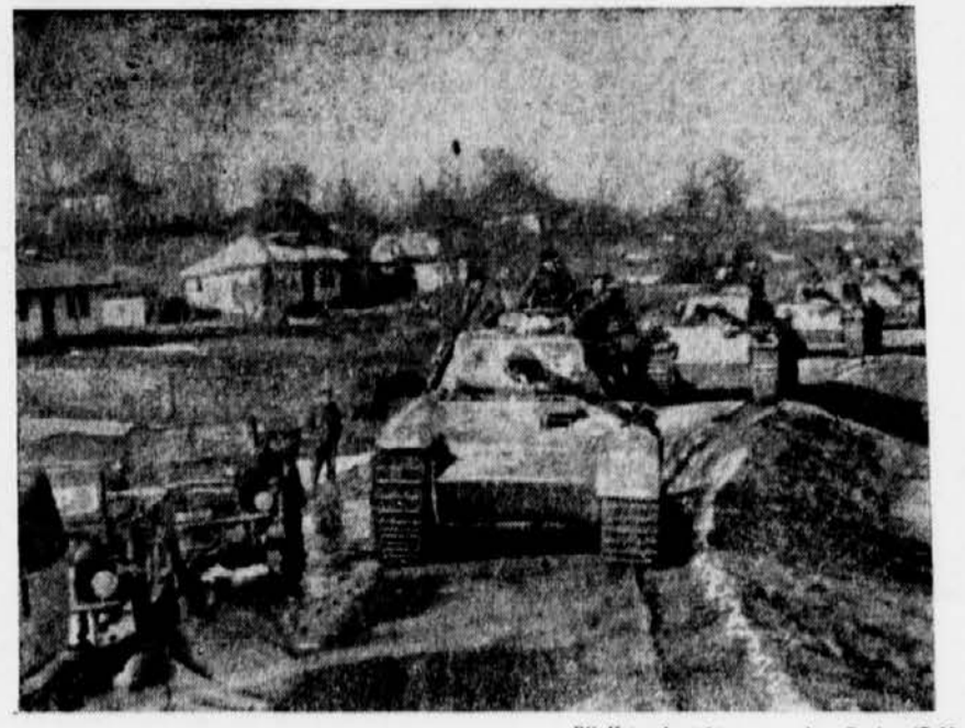
PK Kriegsbericht von der Becke (Sch) Panzerregiment »Großdeutschland« beim Angriff im Raum von Jassy Bei den harten Angriffs- und Abwehrkämpfen im Süden der Ostfront steht die Panzergrenadierdivision »Großdeutschland« stets im Brennpunkt der Schlacht. Unser Bild zeigt: Das Panzerregiment der Division, das sich in den letzten Ta- gen ganz besonders ausgezeichnet hatte, rollt zu einem Angriff im Raum von Jassy nach vorn

und in Arbeitsgruppen aufzuteilen. Die- ser Plan, berichtet ein Sonderkorrespon- dent des Londoner »Observer«, sei vom Londoner Sowjetbotschafter Gusew dem »Europäischen Beratungsausschuß« un- terbreitet worden. Die deutsche Wehrmacht wird den »feinen« Plan zu durchkreuzen wissen. Darauf kann Moskau sich verlassen. Die größte der Gefahren dnb Revel, 8. Mai Admiral Pitka, der ehemalige Befehle- haber der estnischen Seestreitkräfte und Organisator der Panzerzüge im Freiheits- krieg 1918/20 ist wieder nach Estland zurückgekehrt. Admiral Pitka hat sich im Jahre, als die Bolschewisten Estland besetzten, der Verhaftung durch die Flucht nach Finnland entzogen. »In einer Zeit«, so erklärte der Admi- ral dem ersten estnischen Landesdirektor Dr. Mae, »da das Volk, dem ich ent- sprossen bin, um sein Leben ringt, kehre ich zurück. Ich bin überzeugt, daß der Bolschewismus die größte aller Gefahren ist, die unseren Erdteil je bedroht haben. Wenn der Bolschewismus in Europa zur Macht kommen sollte, würde dieses die Vernichtung der abendländischen Kultur und den Untergang aller Völker Europas zur Folge haben. Daher gehören die verantwortlichen Männer der Alliierten, die dem Bolschewismus ihre Hilfe ange- deihen lassen und sich damit selbst ein Strick drehen, zu den Leuten, die nicht wissen, was sie tun.«