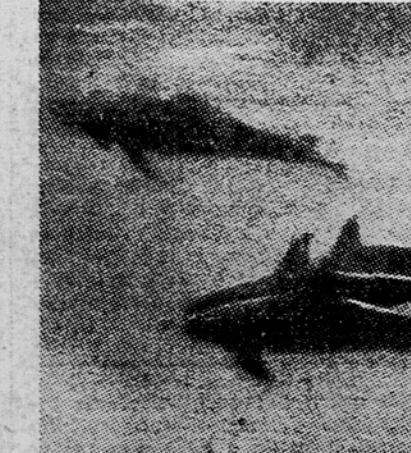
Po trije četrtini plavajo temno drug ob drugem, jaz sem pa ugrabil, kakšna neznan riba je vendar ta, ki ima trikotno hrbtno plavut.

Le nekaj hipov je trajala ta napeta razdvojenost, nato sem se pa z divjimi in upornimi zamahi odločno pognal na odprto morje; za menoj so hitro zginitli rahli obrisi usedline. Kamor koli sem se ozrl, ob straneh in pod menoj, povsod me je obdajala brezkončna modrina, skoznjo so trepetali tanki sončni žarki in se, tako se je zdelo, globoko pod menoj na enem samem mestu združevali. Te črte, ki nastajajo zaradi loma skozi valove, vidimo tudi