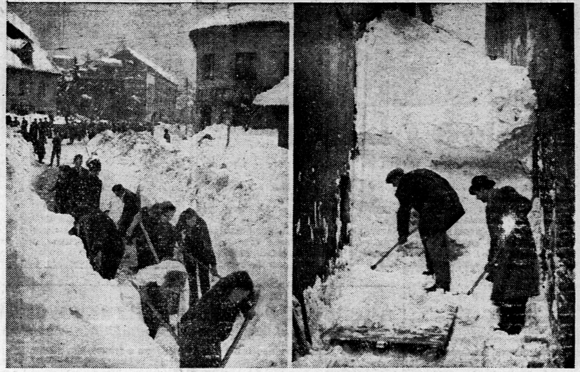
V Ljubljani je čiščenje ulic v polnem razmahu. — Sneg odstranjujejo poleg mobilizirancev tudi številni prostovoljci. — Na sliki vidimo čiščenje tramvajске proge proti Viču, desno pa s snegom zatrpano ulico poleg poslojpa Sloven. ske filharmonije