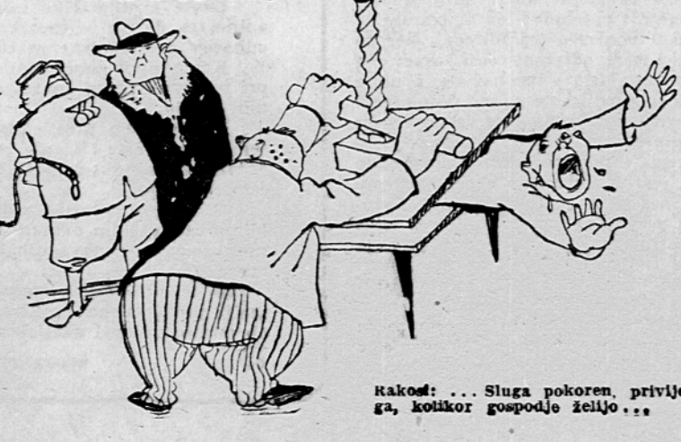
Rakod: ... Sluga pokoren, privilem ga, kotikor gospodje želijo...