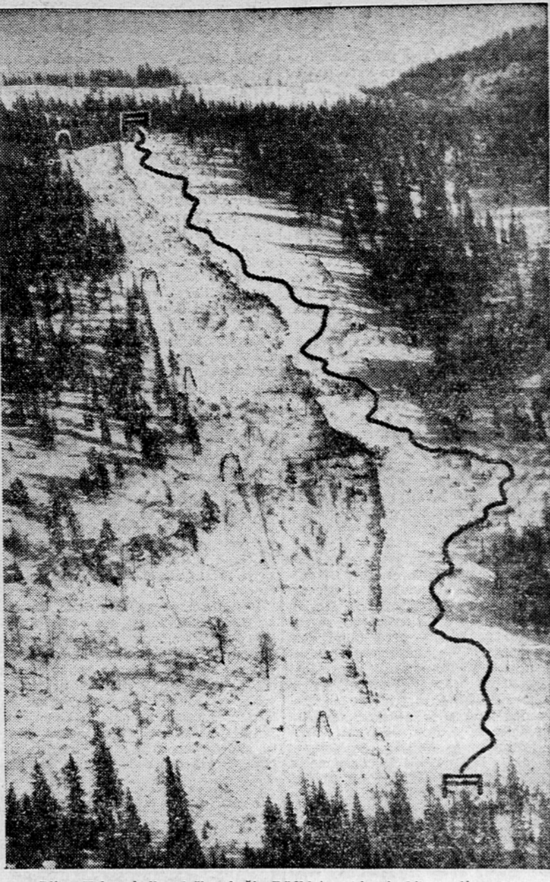
Blizu Holmenkollna leži pobočje Rödskleiva, kjer je bila speljana proga za slalom na letošnjih olimpijskih igrah. Start je 475 m visoko, cilj pa je pri 310 m. — Levo ob progi je speljana vzpenjača za tekmovalce.