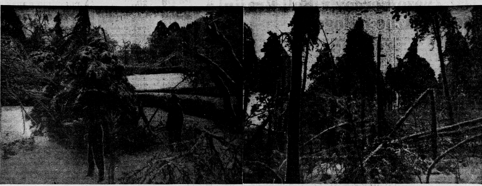
Pod tezo ledu so se v sezamskem okraju podirala in lomila borova drevesa, ki so bila s težko muko vzgojena pri pogozdovanju Krasa. Skoda je ogromna, ker zahteva pogozdo-vanje Krasa posebne skrbi in mnogo truda

Tečaj za združne revizorje Glavna zveza združ Revizorje je uved-la tečaje za združne revizorje. Taki tečaji bodo, za daj v Beogradu, Nišu, Kragujevcu in Prištini, za vojvo-dinske zadruge pa v Novem Sadu.